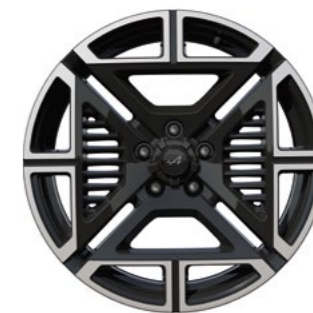
01_ JANTES 19" ICONIC DIAMANTÉES NOIR BRILLANT