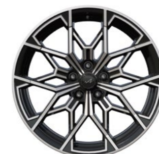
04_ JANTES 19" SNOWFLAKE DIAMANTÉES NOIR BRILLANT