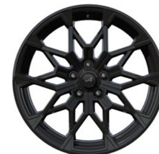
02_ JANTES 19" SNOWFLAKE NOIR BRILLANT