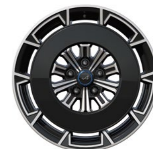
05_ DISQUES AÉRO NOIR BRILLANT POUR JANTES SNOWFLAKE