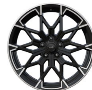
03_ JANTES 19" SNOWFLAKE SEMI DIAMANTÉES NOIR BRILLANT