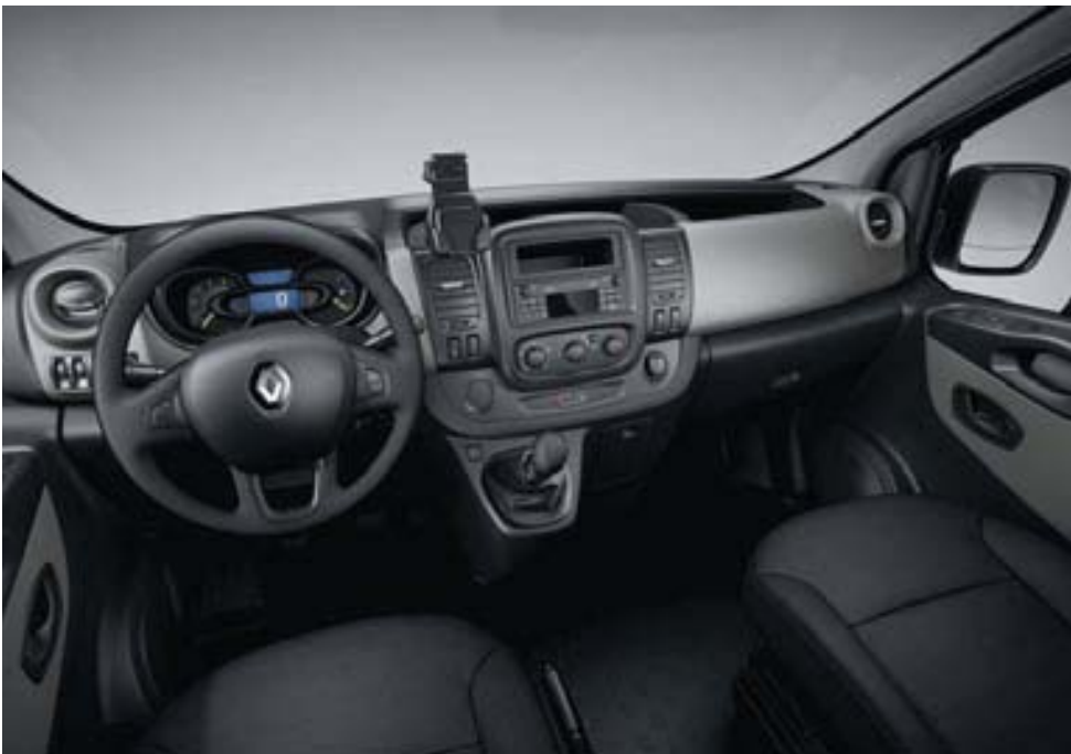
Visuel présenté avec l'option support smartphone