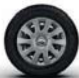
ENJOLIVEUR 16" MAXI