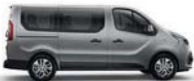
CACHE-RAIL TON CAISSE