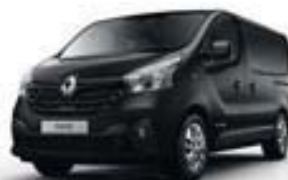
NOIR CRÉPUSCULE (TE D68)**