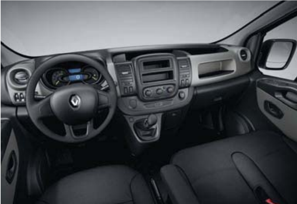
Visuel présenté sans l'équipement Airbag passager (de série)

CHOISISSEZ LE NIVEAU D'ÉQUIPEMENT QUI VOUS CORRESPOND.