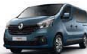
BLEU PANORAMA (TE J43)**