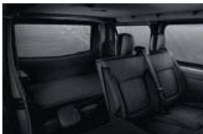
Banquette 1 er rang arrière : démontable et dossier 1/3 rabattable Banquette 2 ème rang arrière : repliable, rabattable et démontable

N ouveau Trafic a le sens de l'ingéniosité, mais aussi de la modularité. Il en faut pour accueillir jusqu'à 9 passagers avec leurs bagages. L'espace aux places arrière est généreux, les passagers sont confortablement installés dans des banquettes redessinées. Pratique et modulable, Nouveau Trafic est doté d'une banquette arrière rabattable, repliable et démontable, pour accueillir encore plus de bagages. La générosité de Nouveau Trafic n'a pas fini de vous surprendre.