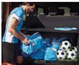
Coffre volumineux avec tablette rabattable