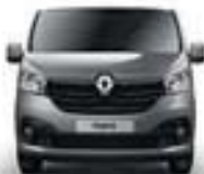
BOUCLIER AVANT SEMI-TON CAISSE, RÉTROVISEURS TON CAISSE, INSERTS CHROME SUR CALANDRE ET BANDEAU NOIR BRILLANT