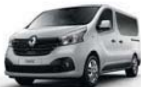
BLANC GLACIER (OV 369)*

OPAQUE, VERNIE, MÉTALLISÉE... LA PALETTE DE COULEURS S'AFFICHE, TEINTÉE D'ÉMOTIONS.