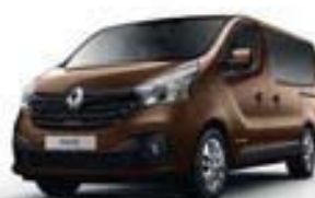
BRUN CUIVRE (TE CNH)**