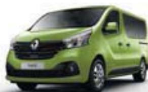
VERT BAMBOU (OV DPA)*