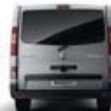
HAYON ARRIÈRE VITRÉ COLONNES LATÉRALES ARRIÈRE TON CAISSE