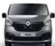
BOUCLIER AVANT SEMI-TON CAISSE