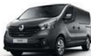
GRIS CASSIOPÉE (TE KNG)**