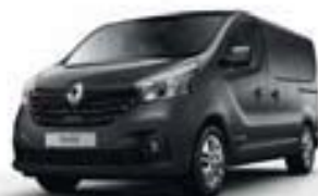
GRIS TAUPE (OV KPF)*