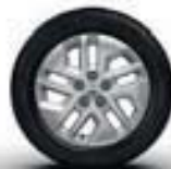
JANTE ALLIAGE 17" CYCLADE