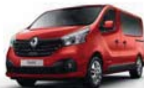
ROUGE MAGMA (OV NNS)*