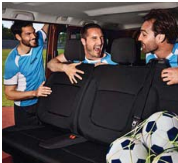
Transporter jusqu'à 9 personnes et leurs bagages