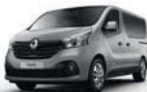
GRIS PLATINE (TE D69)**