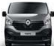
BOUCLIER AVANT NOIR GRAINÉ