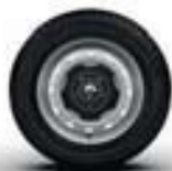
ENJOLIVEUR 16" MINI