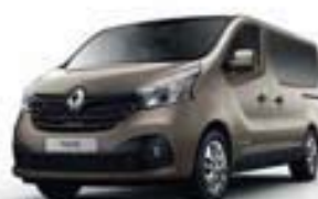
BEIGE CENDRÉ (TE HNK)**