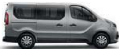
CACHE-RAIL TON CAISSE