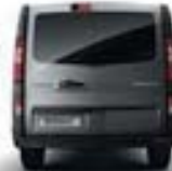
COLONNES LATÉRALES ARRIÈRE NOIR GRAINÉ