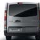
COLONNES LATÉRALES ARRIÈRE TON CAISSE