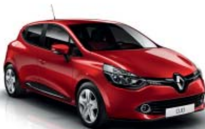
Rojo Deseo (ME)