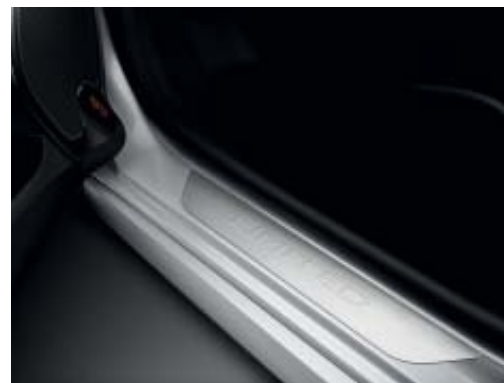
Umbrales de puerta específicos