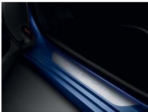
Umbrales de puerta específicos