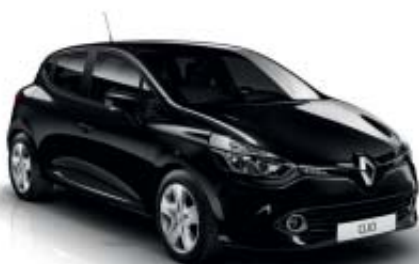
Negro Brillante (M)