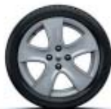
16" Passion standard