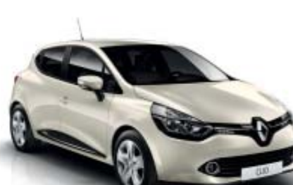
Blanco Marfil (OE)