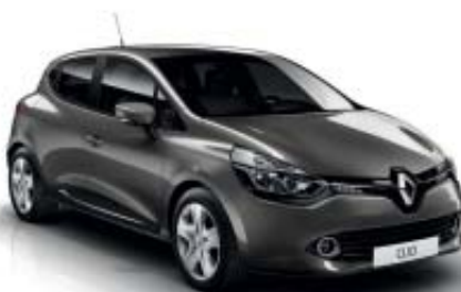
Gris Casiopea (M)