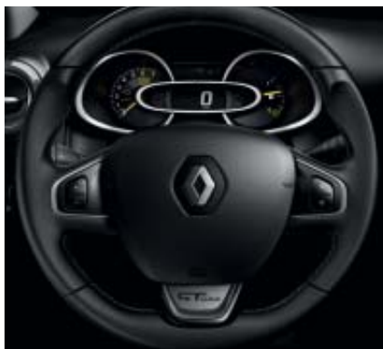
Decoración interior negra