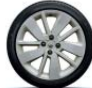
17" Drenalic marfil