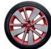
17" Drenalic rojo