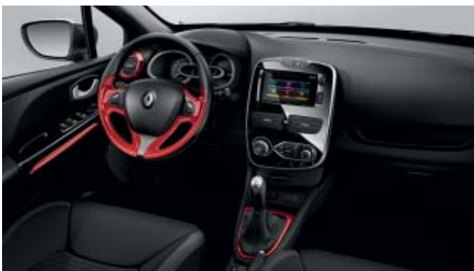
Ambiente interior rojo