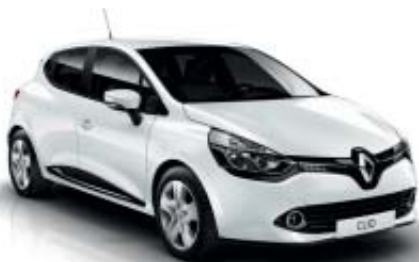
Blanco Glaciar (O)