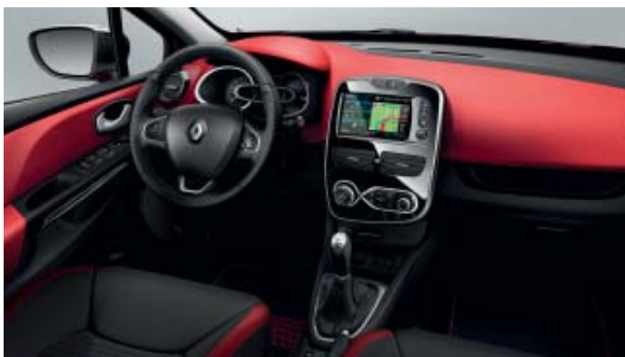
Ambiente interior rojo