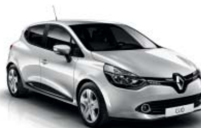
Gris Platino (M)

O: Pintura opaca - OE: Pintura opaca especial M: Pintura metalizada - ME: Pintura metalizada especial Fotos no contractuales / Colores disponibles según versión.