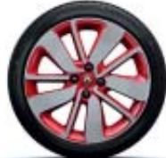
17" Drenalic rojo