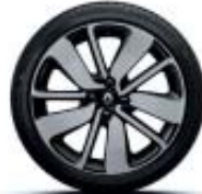
17" Drenalic negro