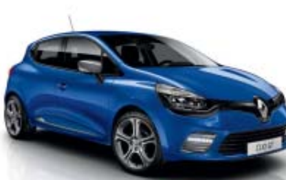
Azul Malta (ME)