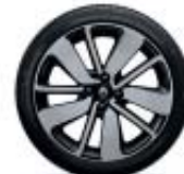
17" Drenalic negro