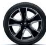
16" Passion negro