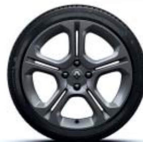
Llantas 17" GT