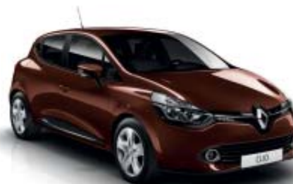
Marrón Fondant (M)