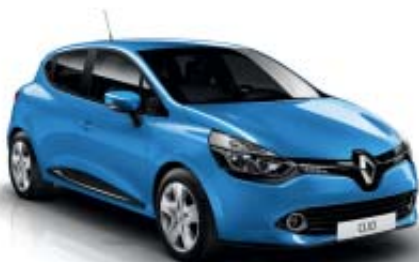
Azul Trendy (OE)