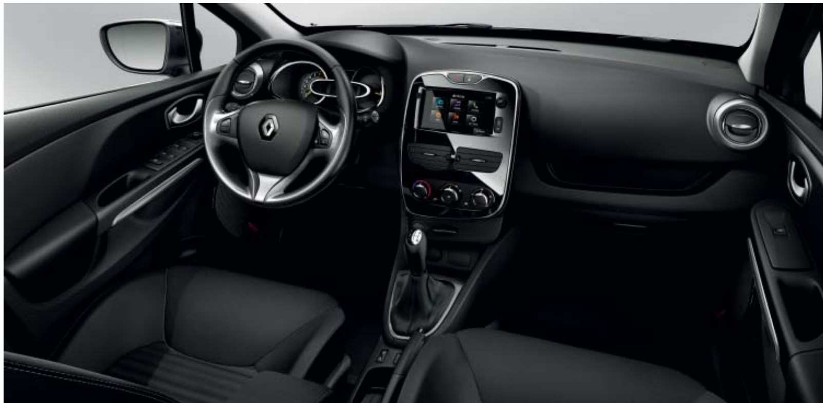
Ambiente interior negro con decoración interior Limited