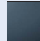
Azul Gris J47 (M)