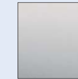
Gris Platino D69 (M)