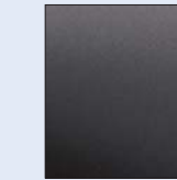
Negro Nacarado 676 (M)