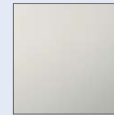
Blanco Glaciar 369 (O)