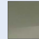
Verde Amanda 190 (M)