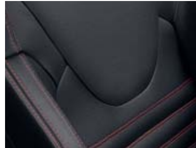
Tapicería alcántara R.S. carbono oscuro con detalles en rojo