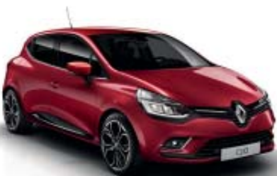
Pack look exterior cromado