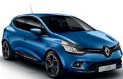
Azul Malta (ME)