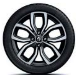
16" Zen negra