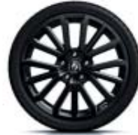
Llantas de aleación de 18" R.S. negro brillante