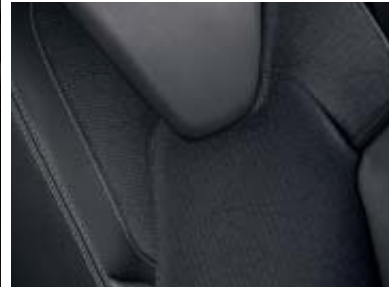
Tapicería Tep terciopelo negro