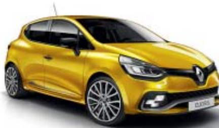
Amarillo Racing* (M)