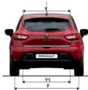
CLIO SPORT TOURER