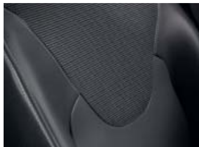
Tapicería tejido Negro/Gris