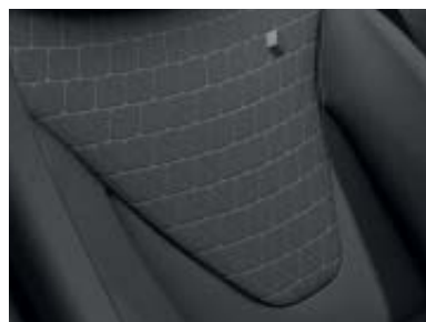
Tapicería específica Limited