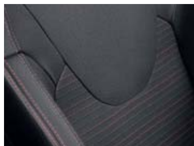
Tapicería R.S. tejido con detalles en rojo