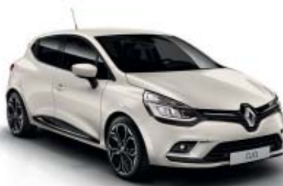
Blanco Marfil (OE)