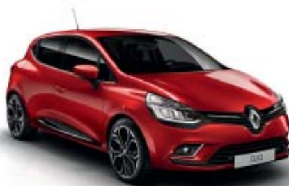
Rojo Deseo (ME)