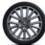
Llantas de aleación de 17" R.S.