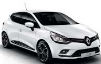
Blanco Glaciar (O)