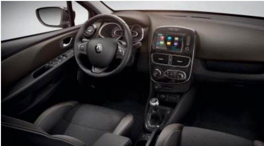
Ambiente interior gris satinado