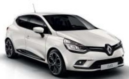
Blanco Nacarado (M)