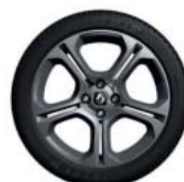
17" GT Line