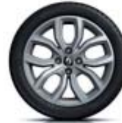
Llanta de 16'' Zen