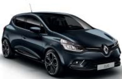
Gris Titanium (M)