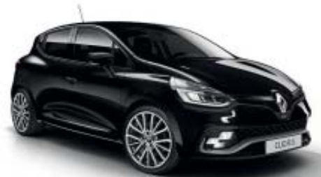
Negro Profundo* (M)

O: Pintura opaca - OE: Pintura opaca especial