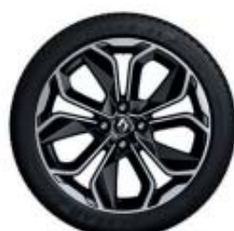
17" Zen negra