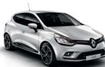
Gris Platino (M)