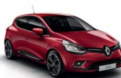
Rojo Intenso (M)