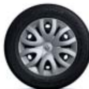
Embellecedor 15" Paradise