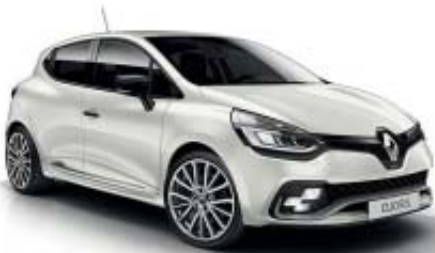
Blanco Nacarado R.S.* (M)