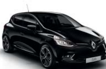
Negro Brillante (M)