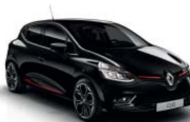
Pack look exterior rojo