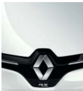
BLANCO GLACIAR (O)

OPACOS, METALIZADOS...LA PALETA DE COLORES SE EXPONE.