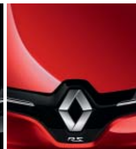
ROJO DESEO (ME)

O = Pintura Opaca M = Pintura Metalizada ME = Pintura Metalizada Especial