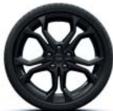
LLANTAS DE ALEACIÓN RADICAL 18" NEGRO BRILLANTE