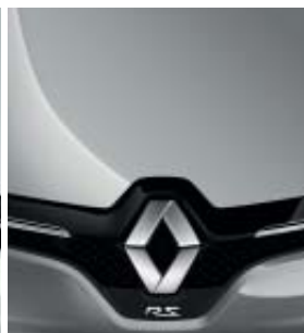
GRIS PLATINO (M)