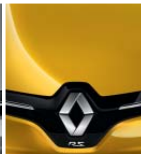
AMARILLO RACING (ME)