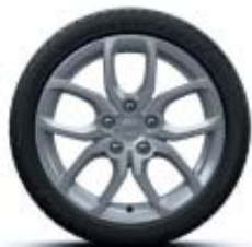
LLANTAS DE ALEACIÓN SILVER 17"