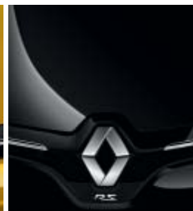
NEGRO PROFUNDO (M)