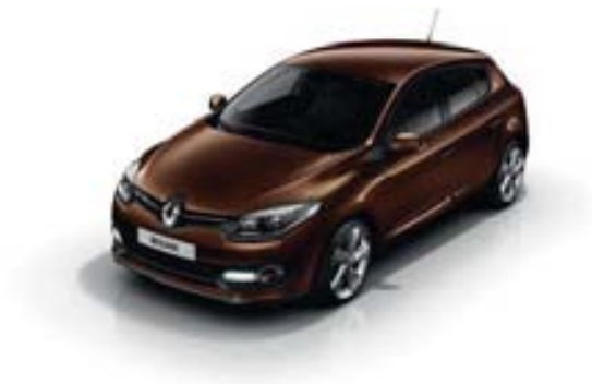
MARRON GLACÉ* (TE)