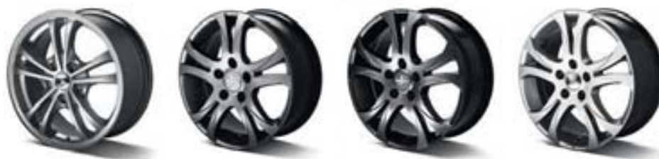
Jante Asteria 16"