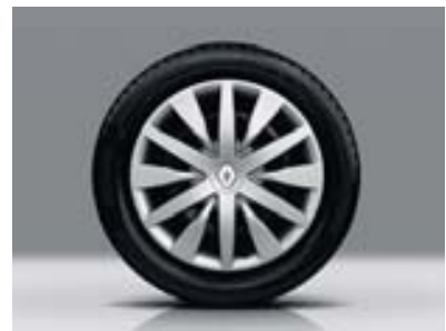
Enjoliveur Complea 16"

ABS et assistance au freinage d'urgence Climatisation manuelle Contrôle dynamique de trajectoire ESP Lève-vitres avant électriques Projecteurs antibrouillard R-Plug&Radio+ (CD MP3, Bluetooth®, Plug&Music) Régulateur-limiteur de vitesse Rétroviseurs électriques et dégivrants Siège conducteur réglable en hauteur