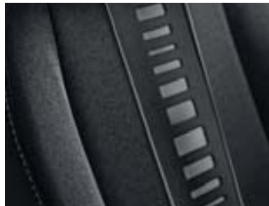
Sellerie Tissu Java Carbone très foncé

Barres de toit chrome satiné (sur Estate) Capteur de pluie et de luminosité Climatisation automatique bi-zone Console centrale avec accoudoir Feux de jour à LED Jantes alliage 16" Lève-vitres arrière électriques Protections latérales ton caisse Réglage lombaire siège conducteur Volant cuir