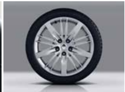
Jante alliage Celsius dark metal 17"