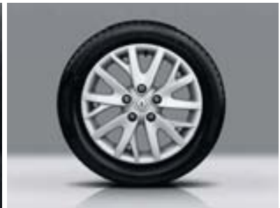
Jante alliage Eptius 16"