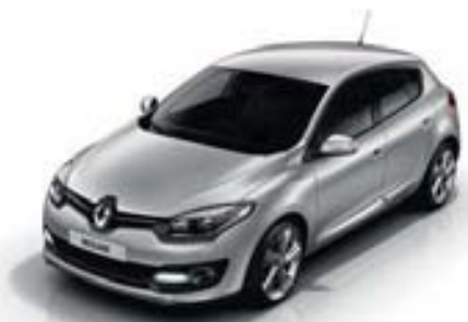
GRIS PLATINE (TE)