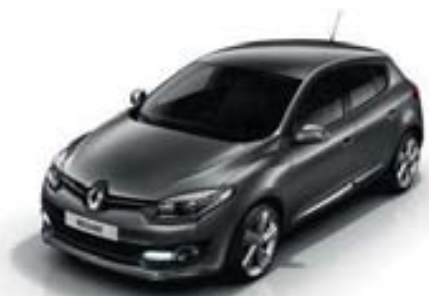
GRIS CASSIOPÉE* (TE)