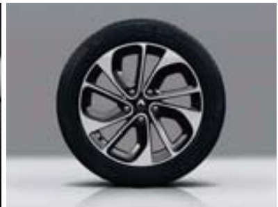
Jante alliage Akihiro diamantée noire 17"