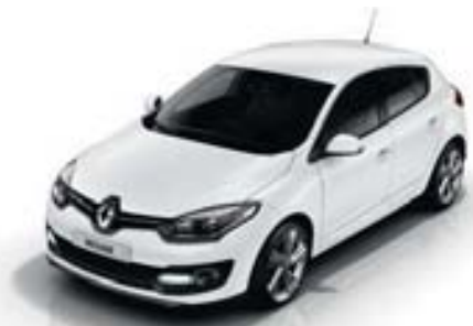
BLANC GLACIER (OV)