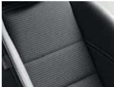
Sellerie TEP / Tissu Renault Sport

Aide au parking arrière Boucliers avant et arrière sport Jantes alliage 17" Rétroviseurs rabattables électriquement Sièges Renault Sport