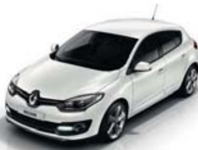
BLANC NACRÉ (TE)