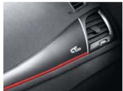
Baguette planche de bord GT-Line