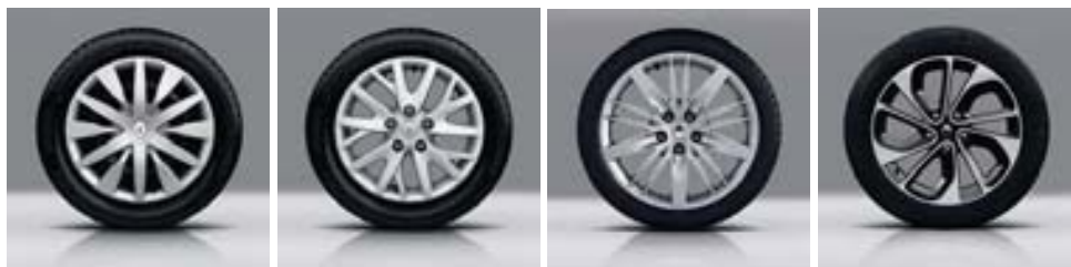
Enjoliveur Complea 16"