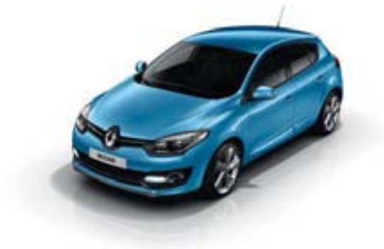
BLEU MAJORELLE* (TE)