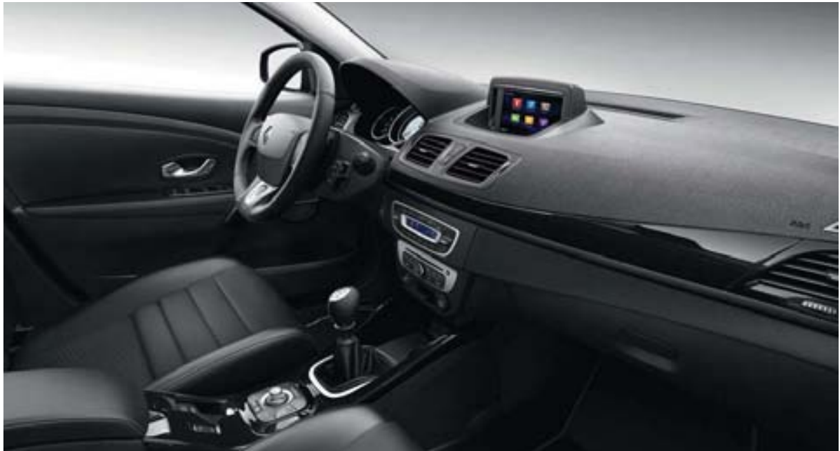
Version présentée: Bose® avec option pack cuir