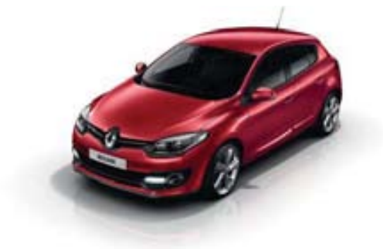
ROUGE DYNA (TE)