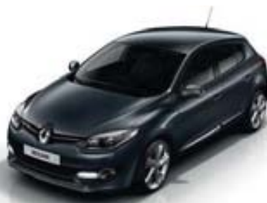
GRIS ÉCLIPSE (TE)