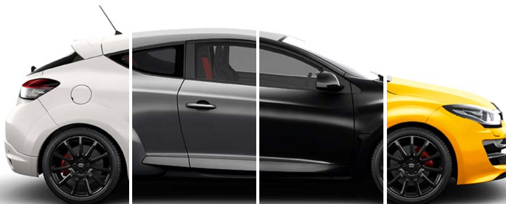
QNC Perlmutter-Weiß 1