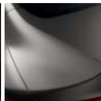
BEIGE CENIZA (M)