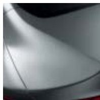
GRIS PLATINO (M)