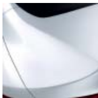
BLANCO NACARADO (MS)