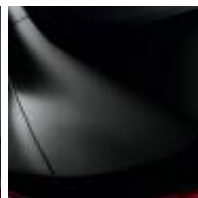
NEGRO NACARADO (M)