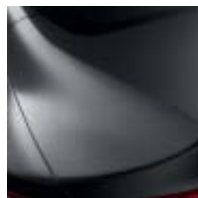
GRIS CASIOPEA (M)