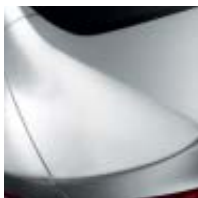
BLANCO GLACIAR (O)

OPACOS, METALIZADOS... LOS COLORES SE ELIGEN.