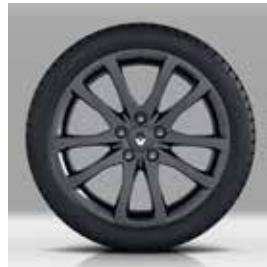
Leichtmetallräder „Interlagos dark“, 18 Zoll