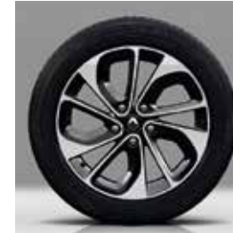
Leichtmetallräder „Akihiro“ (bitonal), 17 Zoll

**Bei Automatikgetriebe in Textillieder.