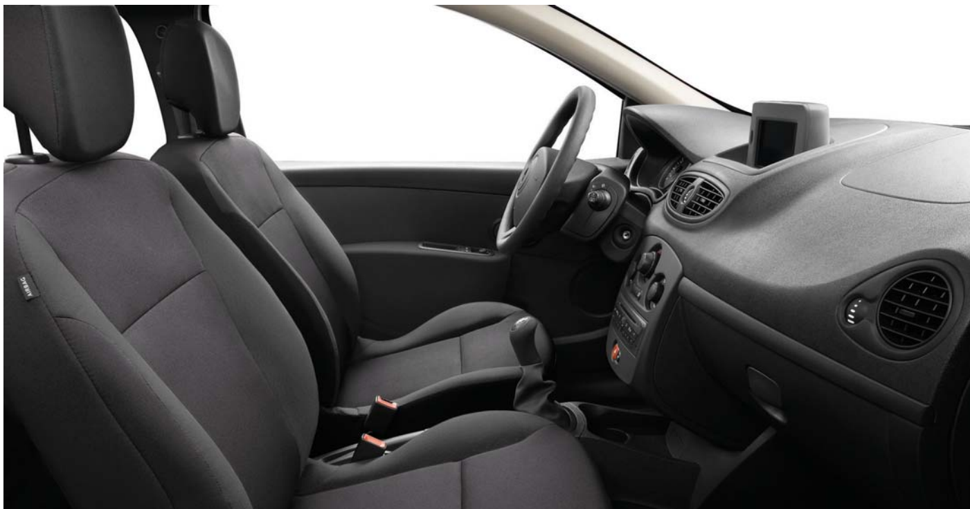
version présentée avec options Pack Audio et Carminat TomTom

JOUER AVEC LES MATIÈRES ET LES COULEURS, POUR CHOISIR VOTRE INTÉRIEUR.