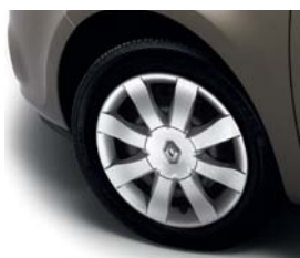
Enjoliveur 15" Taranis