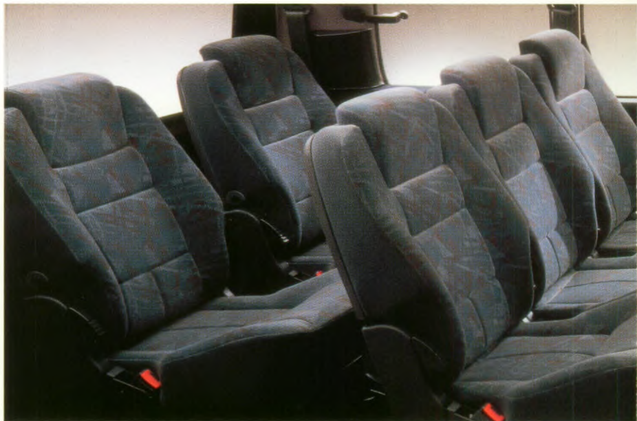
Renault Espace Helios met 2 extra stoelen. Smaakvol en uiterst comfortabel interieur.

baar zijn en in slaapstand kunnen worden gezet • 2 extra achterstoelen • Bagagedek • Verplaatsbare dakrelings • 4x15W radio-cassettespeler of 4x15W radio-CD- speler met een bedieningssatelliet aan de stuurkolom en 6 luidsprekers • 2 zonne- daken • Automatische 4-versnellingsbak (2.2i) • Mistlampen in de voorbumper.