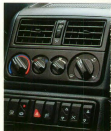
Airconditioning standaard op alle uitvoeringen m.u.v. de Cyclade.