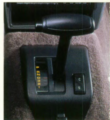
Automatische 4-versnellingsbak ook op 4-cilinder uitvoeringen.

baar zijn en in slaapstand kunnen worden gezet • 2 extra achterstoelen • Bagagedek • Verplaatsbare dakrelings • 4x15W radio-cassettespeler of 4x15W radio-CD- speler met een bedieningssatelliet aan de stuurkolom en 6 luidsprekers • 2 zonne- daken • Automatische 4-versnellingsbak (2.2i) • Mistlampen in de voorbumper.