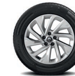
Leichtmetallfelgen „Lapiaz“, 18 Zoll, serienmäßig für Intens, optional für Life