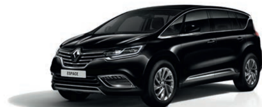
GNE Black Pearl-Schwarz