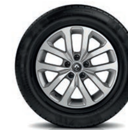
Leichtmetallfelgen „Aquila“, 17 Zoll, serienmäßig für Life