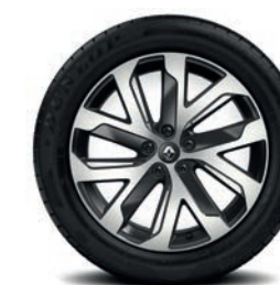
Leichtmetallfelgen „Quarz“, 19 Zoll, optional für Intens