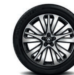
Leichtmetallfelgen „Initiale Paris“, 19 Zoll, serienmäßig für Initiale Paris