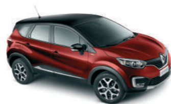
CARROCERIA Vermelho Fogo TETO Preto Nacré