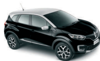
CARROCERIA Preto Nacré TETO Prata Étoile