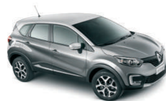
CARROCERIA Cinza Cassiopée TETO Prata Étoile