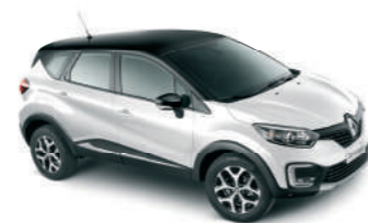
CARROCERIA Branco Glacier TETO Preto Nacré