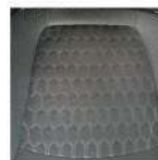
Asiento de tela.