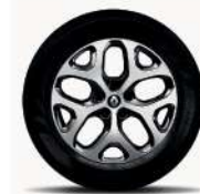
Rin de aluminio bitono 17".