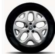
Rin de aluminio 17".