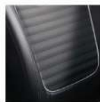
Asiento tipo piel.