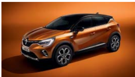
Orange Atacama (1)

(1) peinture métallisée. (2) opaque vernis. photos non contractuelles.