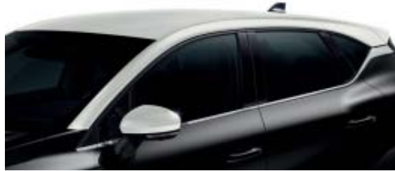
Blanc Albâtre : toit et coques de rétroviseur