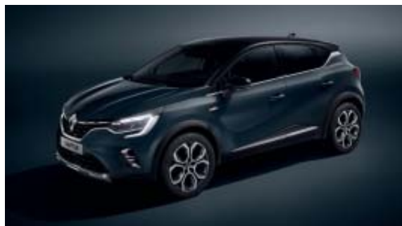
Bleu Marine Fumé (2)