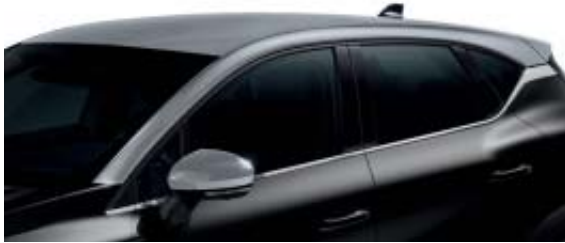
Gris Highland : toit et coques de rétroviseur