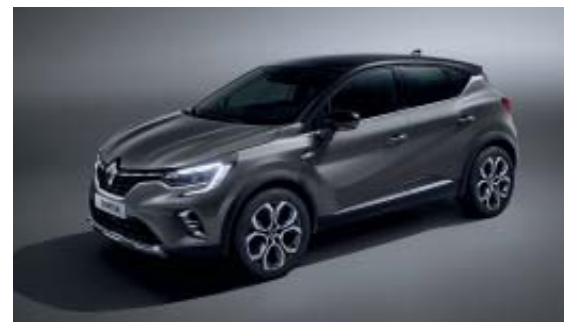
Gris Cassiopée (1)