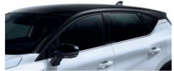
Noir Étoilé : toit et coques de rétroviseur