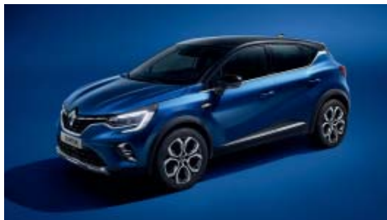
Bleu Iron (1)