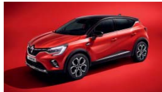
Rouge Flamme (1)