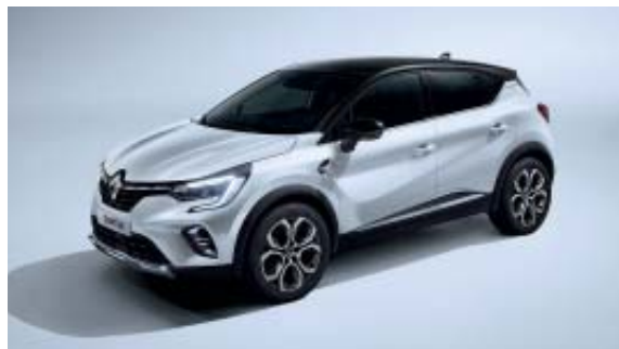
Blanc Nacré (1)