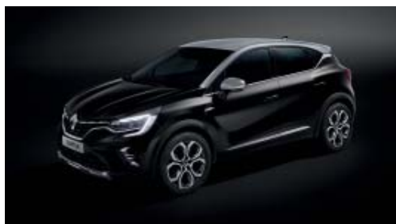
Noir Étoilé (1)