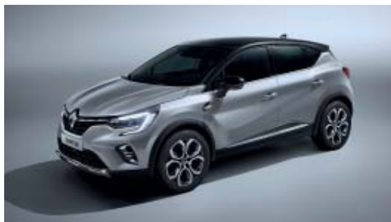
Gris Highland (1)