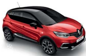
Rouge Flamme** Toit Noir Étoile (XPA) sauf Initiale Paris