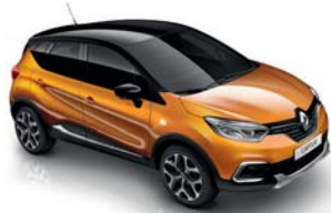
Orange Atacama Toit Noir Étoile (XWB) sauf Initiale Paris