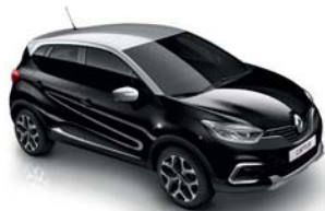
Noir Étoile Toit Gris Platine (XVT)