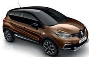
Brun Cappuccino Toit Noir Étoile (XTH)