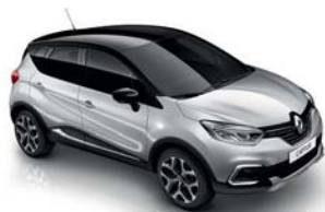
Gris Platine Toit Noir Étoile (XNM)