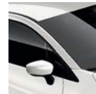
Toit Blanc Nacré** (QNC)