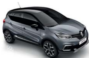
Gris Cassiopée Toit Noir Étoile (XNK)