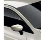
Toit Blanc Ivoire* (D16)