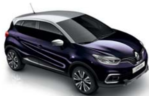
Noir Améthyste** Toit Gris Platine (XVY) uniquement Initiale Paris