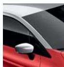
Toit Gris Platine (XVW)