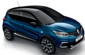
Bleu Océan Toit Noir Étoile (XWD) sauf Initiale Paris