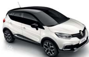
Blanc Nacré** Toit Noir Étoile (XUI)