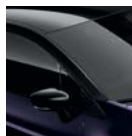
Toit Noir Étoile (XWC)