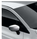
Toit Gris Platine (D69)