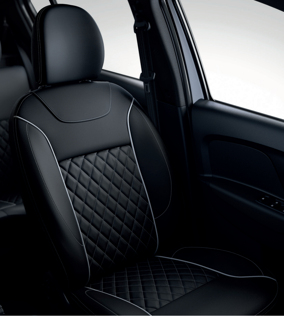
vestiduras de asiento de piel sintética A/A automático