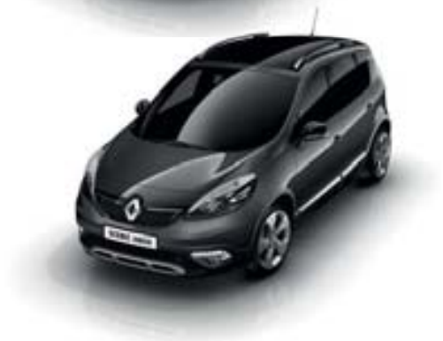
GRIS CASSIOPÉE (TE)