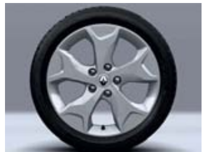
Jante aluminium Tennessee 17"

6 Airbags ABS avec assistance au freinage d'urgence Barres de toit longitudinales Capteurs de pluie et de luminosité Climatisation régulée et aérateurs latéraux de rang 2 Contrôle dynamique de trajectoire ESP avec aide au démarrage en côte Écran couleur personnalisable à technologie TFT Jantes alliage 17" Tennessee R-Plug&Radio+, CD MP3, Bluetooth®, Plug & Music Régulateur-limiteur de vitesse Siège conducteur réglable en hauteur Vitres latérales et arrière surteintées Volant cuir réglable en hauteur et en profondeur