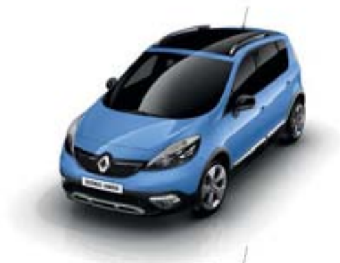
BLEU MAJORELLE (TE)