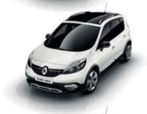
BLANC NACRÉ (TE)