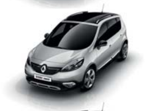
GRIS PLATINE (TE)