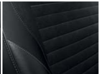
Sellerie TEP/velours carbone foncé