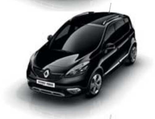
NOIR ÉTOILÉ (TE)