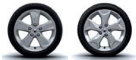
JANTE ALLIAGE CRUSOE 16" JANTE ALLIAGE TENNESSEE 17" (uniquement avec Extended Grip)