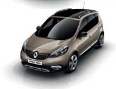
BEIGE DUNE (TE)

OV : opaque verni TE : teinte métallisée à effets Photos non contractuelles.