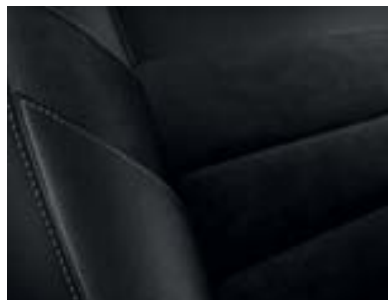
Pack Cuir Alcantara