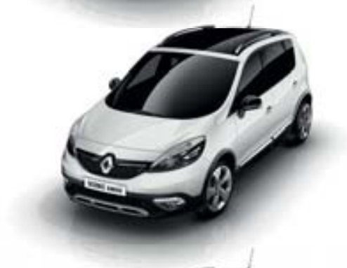
BLANC GLACIER (OV)