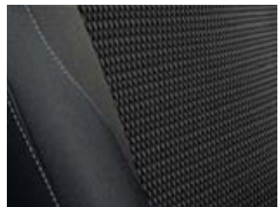
Sellerie «nid d'abeille» carbone foncé/gris fumé