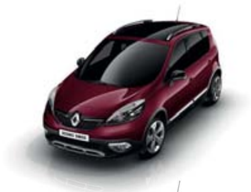
ROUGE GRENAT (TE)

OPAQUE, MÉTALLISÉE... LA PALETTE DE COULEURS S'AFFICHE.