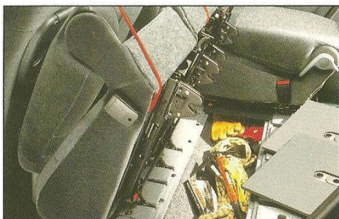
Compartimento para objetos, sob os bancos.