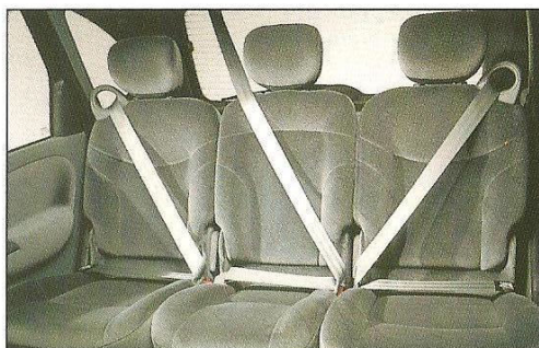
Bancos traseiros individuais, com cintos de 3 pontos.

Renault Scénic. Mais do que um carro projetado, um carro planejado. Com ele, a Renault confirma o conceito monovolume no Brasil: compartimento interno, motor e porta-malas integrados em um único volume. O resultado é um carro com muito mais espaço. Inteligente na versatilidade, com seus bancos traseiros deslizantes, rebatíveis, removíveis e reposicionáveis, que permitem diferentes configurações sem o menor esforço. Inteligente no aproveitamento do espaço, com diversos compartimentos para acomodar tudo o que você quiser. Renault Scénic. Tão inteligente que muda para acompanhar você.