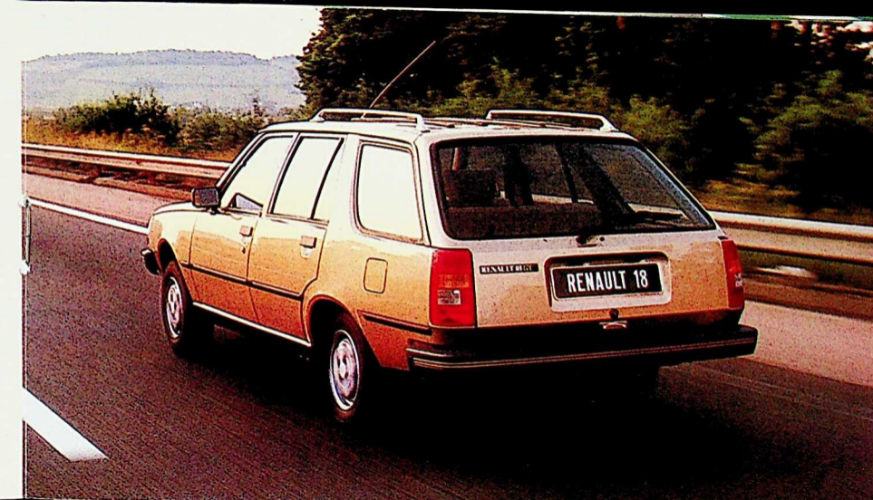
Renault 18 Break Renault 18 Break 1397 cm 3 - 6 CV Renault 18 TL Break 1397 cm 3 - 6 CV Renault 18 GTL Break 1647 cm 3 - 7 CV Renault 18 GTS Break 1647 cm 3 - 8 CV