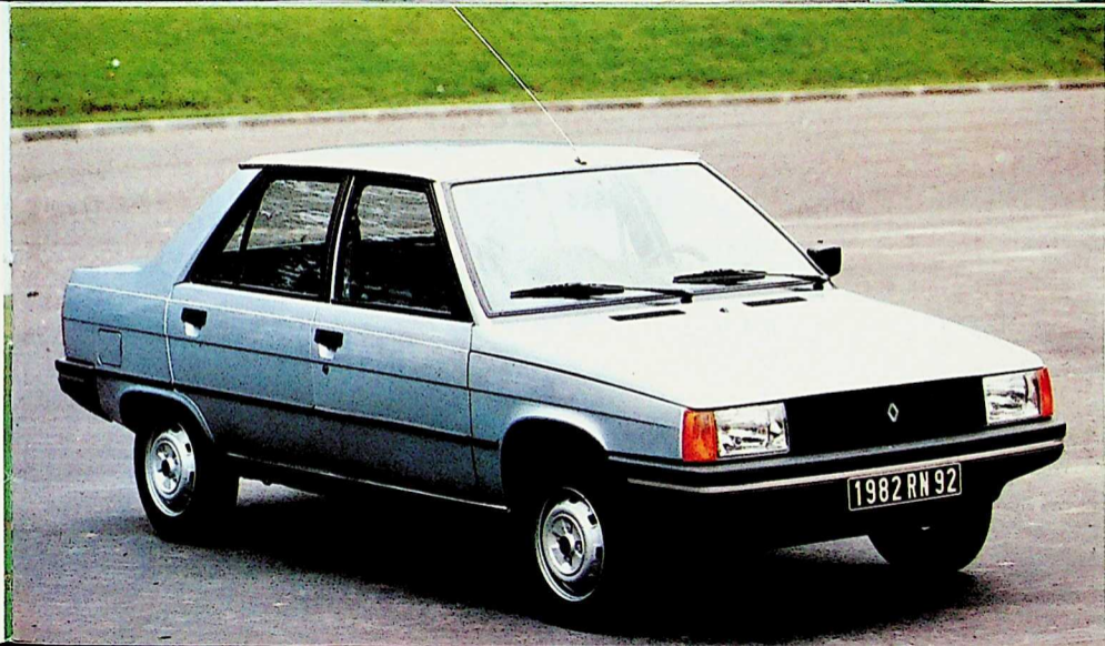
Renault 9 TC