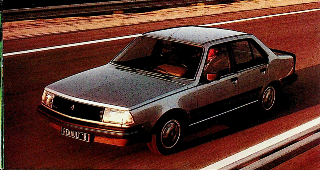
Renault 18 Renault 18 Turbo 1565 cm 3 - 7 CV