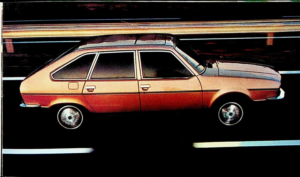
Renault 20 TD