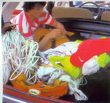
Maletero de gran capacidad. Amplia puerta trasera.