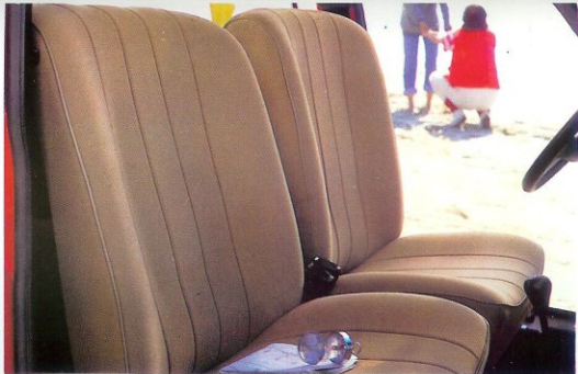
Asientos anatómicos, respaldo alto y reclinable