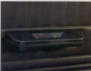
Apoyacodos en las puertas delanteras.