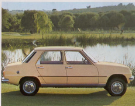
Lunas coloreadas en verde que descanzan la vista, haciendo más agradables los viajes. (Versión TL.)