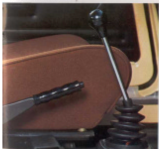
Palanca de cambios situada en el piso y freno.