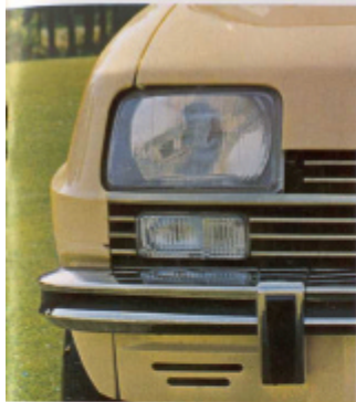
Faros rectangulares incrustados en la calandra y regulables en altura.