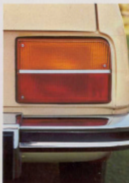
Faros traseros de gran tamaño. Bien visibles.