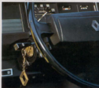
Todas las cerraduras se abren con la misma llave.