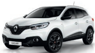
Blanc Glacier 369 (V)