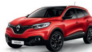
Rouge Flamme NNP (SMV)