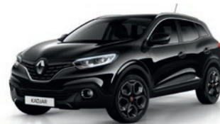
Noir Étoilé GNE (MV)