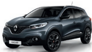
Gris Titanium KPN (MV)