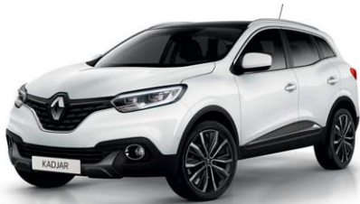
BIANCO GHIACCIO (VO)