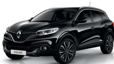
NERO  TOIL  (VM)