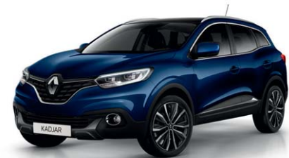
BLU COSMO (VM)