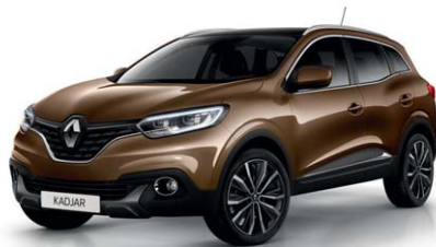
MARRONE CAMELLO (VM)