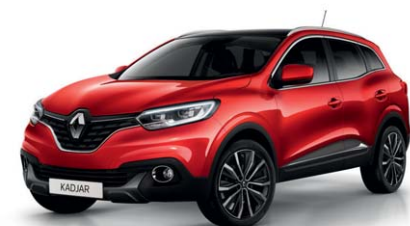
ROSSO PASSION (VM)*