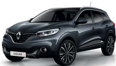
GRIGIO TITANIO (VM)