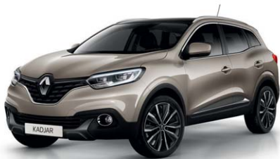
BEIGE DUNA (VM)