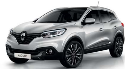
GRIGIO PLATINO (VM)