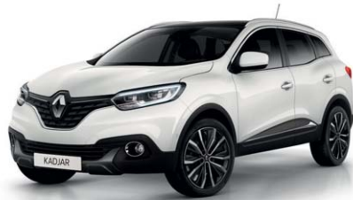
BIANCO NACR  (VM)*