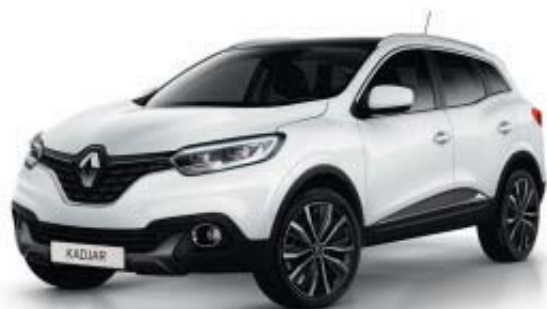
BLANC GLACIER 369 (V)