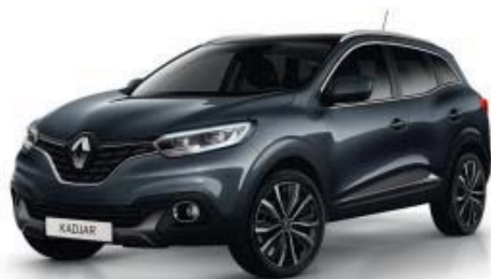
GRIS TITANIUM KPN (MV)