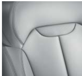
Bekleding rundleder licht grijs (optioneel)