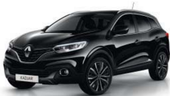
NOIR ÉTOILÉ GNE (MV)