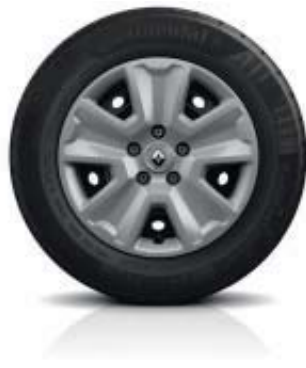
Stalen wielen 16" met wioldop 'Pragma'