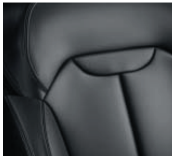
Bekleding rundleder antraciet (optioneel)