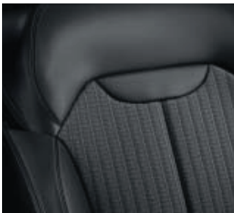
Bekleding kunstleder TEP/stof 'Bose' antraciet