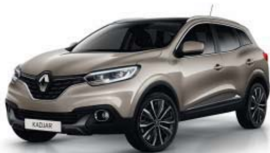
BEIGE DUNE HNP (MV)