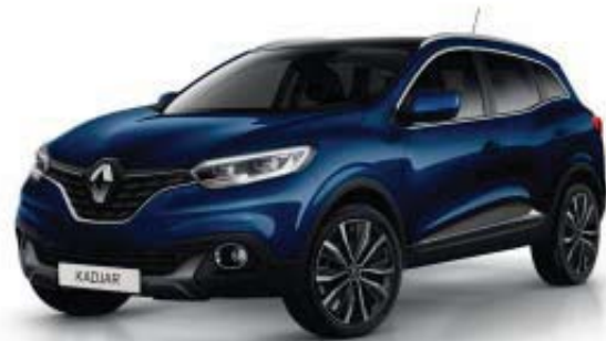
BLUE COSMOS RPR (MV)