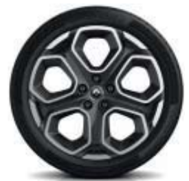
Lichtmetalen wielen 19" 'Extreme' (optioneel)