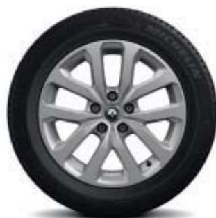
Lichtmetalen wielen 17" 'Aquila'