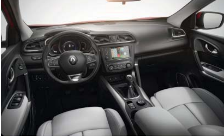
Interieur Kadjar Intens met optionele bekleding rundleder licht grijs