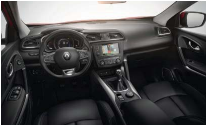
Interieur Kadjar Intens met optionele bekleding rundleder antraciet