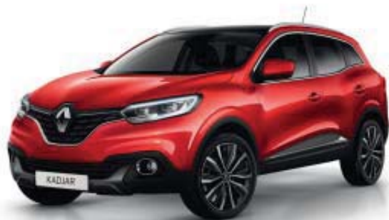
ROUGE FLAMME NNP (SMV)