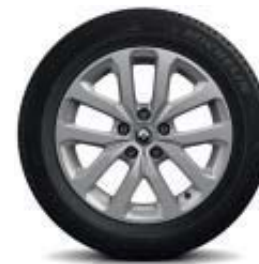
Lichtmetalen wielen 17" 'Aquila'

In de Kadjar Intens staat rijplezier voorop. Het standaard Renault R-Link 2 multimedia- en navigatiesysteem bengt u naar nieuwe avonturen. Tijdens het rijden waakt het Visio Systeem met Lane Departure warning over uw veiligheid en parkeren is extra eenvoudig door de standaard parkeersensoren voor én achter.