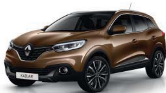
BRUN CAPPUCCINO CNL (MV)