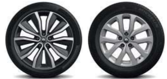
Lichtmetalen wielen 19" 'Egeus'

Ontdek nieuwe klanken in de Kadjar Bose®. Voor de ultieme geluidsbeleving is dit premium audiosysteem voorzien van 4 speakers, 2 tweeters, een versterker en een subwoofer. Het exterieur maakt een krachtige indruk door de 19" lichtmetalen wielen en de LED PURE VISION koplampen.