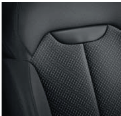
Bekleding stof Antraciet