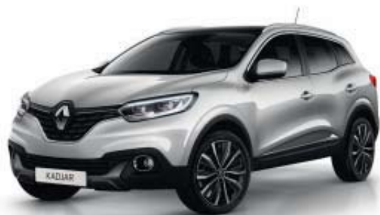
GRIS PLATINE D69 (MV)