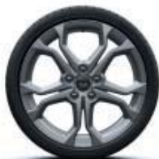
18" DARK MÉTAL