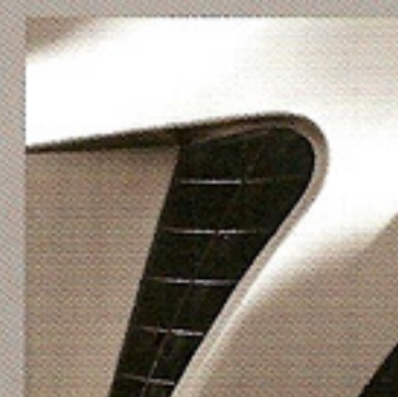
Gris Makaha (F60)***