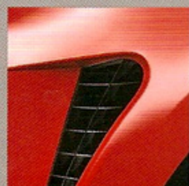
Rouge Toro (NNF)**