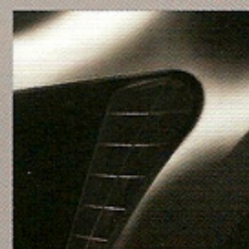
Noir Profond (GNA)***