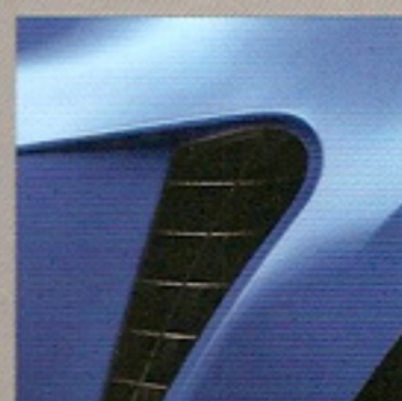
Bleu Monaco (RNC)***