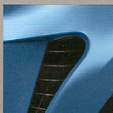
Bleu Dynamo (J45)**