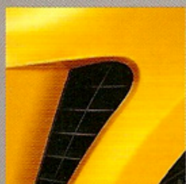
Jaune Sirius (J37)***