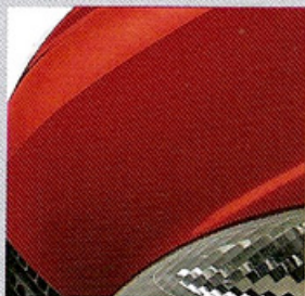
876 ROUGE DE FEU (TE)