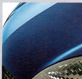
432 BLEU MÉTHYL (NV)