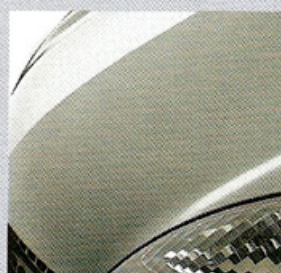
640 GRIS ICEBERG (MV)