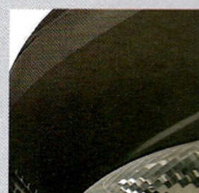
676 NOIR NACRÉ (NV)

MV = Métallisée vernie NV = Nacrée vernie TE = Teinte à effets