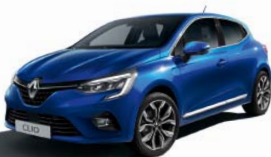
Bleu Iron (TE)