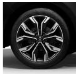
Jantes alliage 17" Viva Stella diamantées Noir