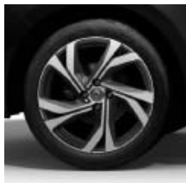
Jantes alliage 17" Magny-cours