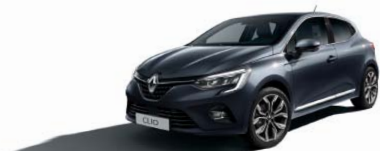
Gris Titanium (TE)