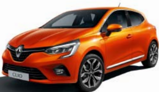
Orange Valencia* (TE)