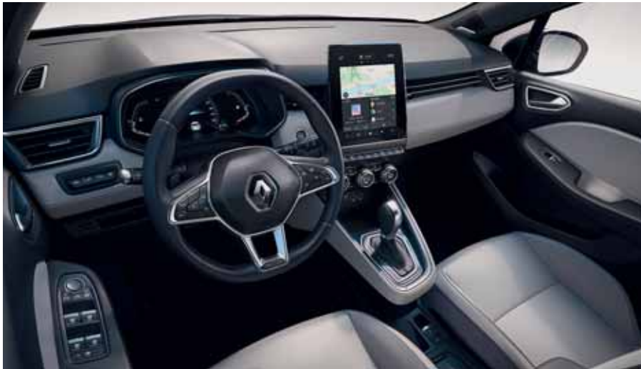
Ambiance INITIALE PARIS Claire