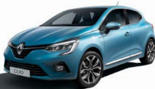
Bleu Celadon (TE)