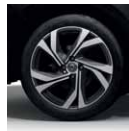
Jantes alliage 17" Magny-cours