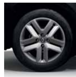
Enjoliveurs 16" Amicitia