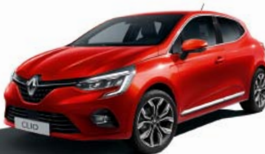
Rouge Flamme* (TE)