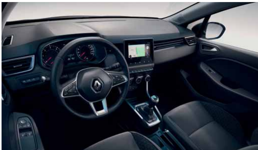
Visuel présenté avec pack Navigation en option