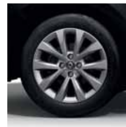
Jantes alliage 16" Philia