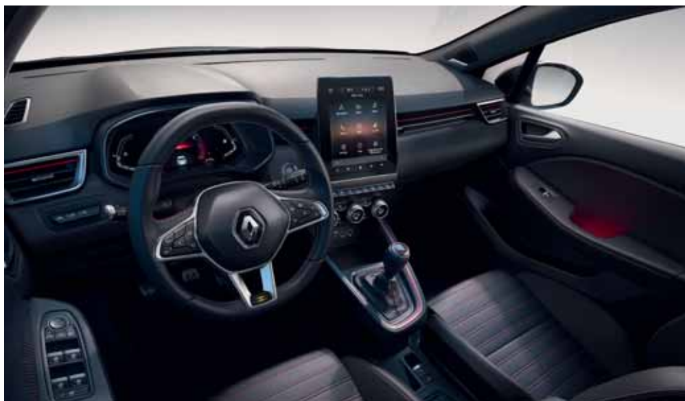
Visuel présenté avec pack Techno Bose en option