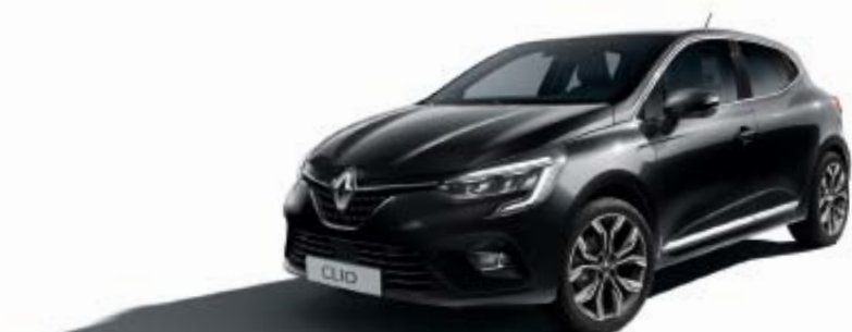
Noir Etoilé (TE)

TE : peinture métallisée. OV : opaque verni. Photos non contractuelles * Peinture métallisée avec vernis spécial