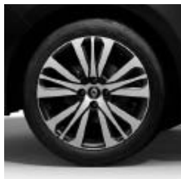
Jantes alliage 17" Initiale Paris