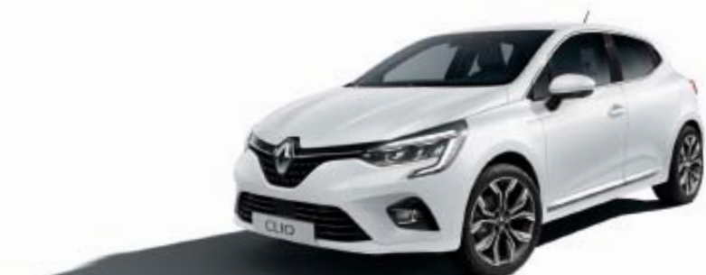
Blanc Glacier (OV)