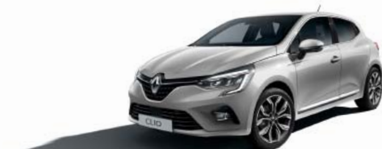
Gris Platine (TE)