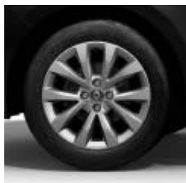
Jantes alliage 16" Philia