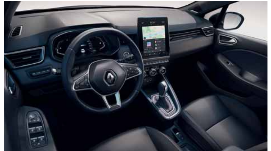
Ambiance INITIALE PARIS Foncée