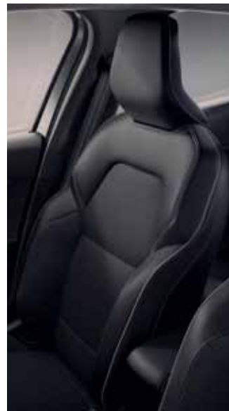
Sellerie mixte similicuir Velours