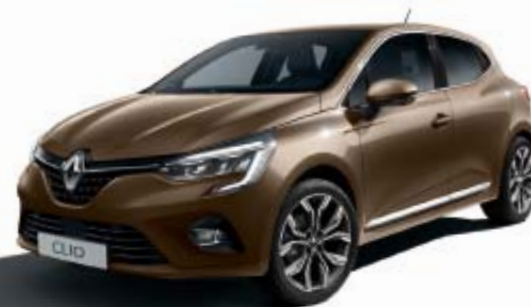
Brun Vison (TE)