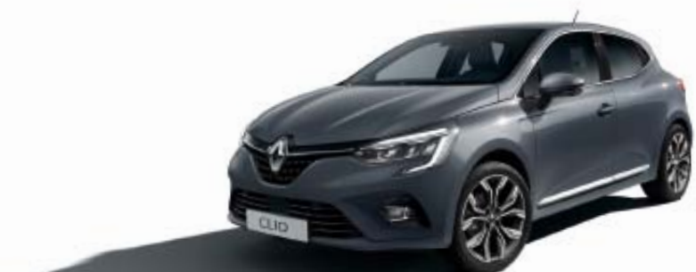
Gris Urban (TE)