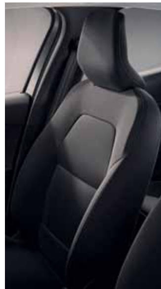
Sellerie Tissu Noir