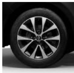
Jantes alliage 16" Philia diamantées Noir