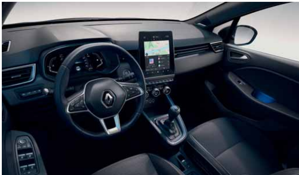
Visuel présenté avec pack Techno Bose en option