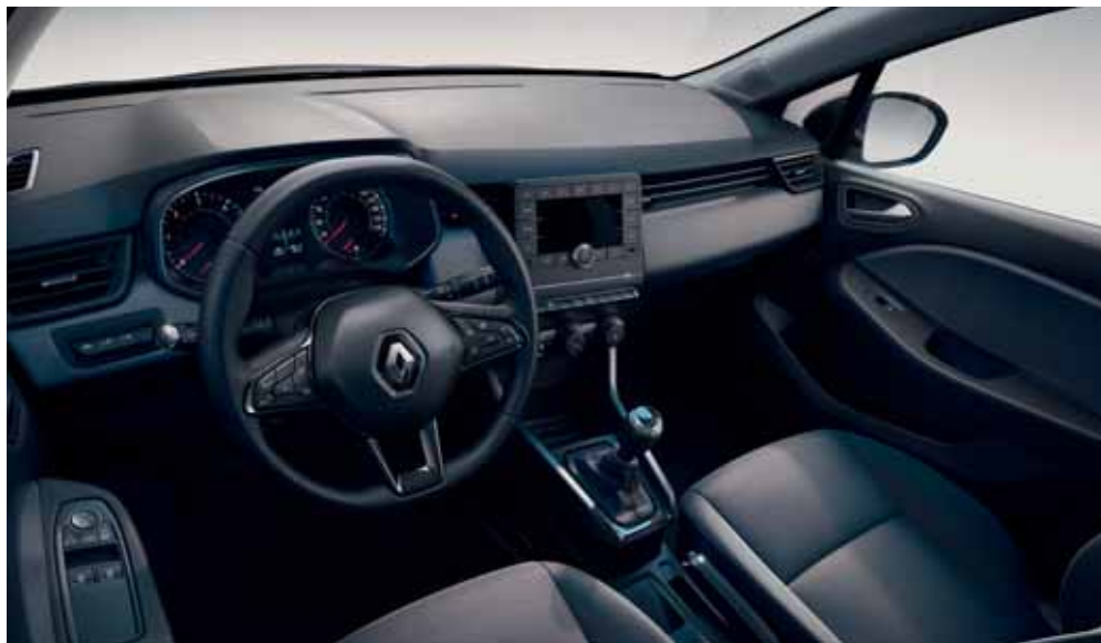
Visuel présenté avec Radio Connect R&Go en option