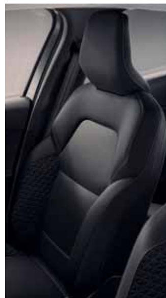
Sellerie tissu Noir avec motifs surpiqués