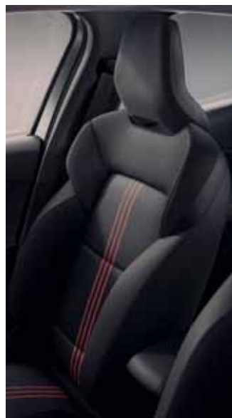
Sellerie tissu RS -Line