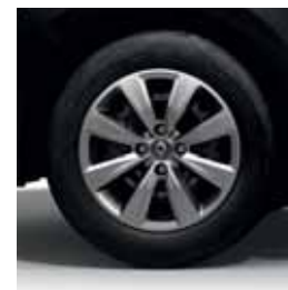
Enjoliveurs 15" Iremia