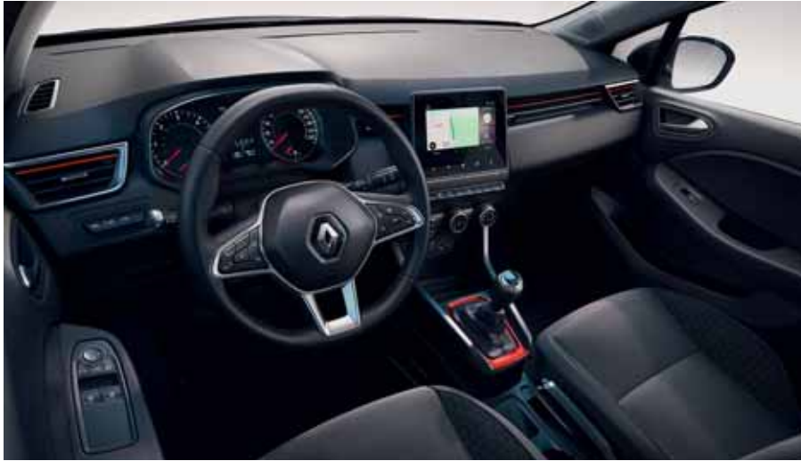
Pack de personnalisation rouge