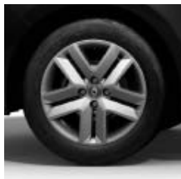
Enjoliveurs 16" Amicitia