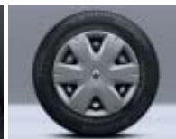
Enjoliveur Caraïbes 15"