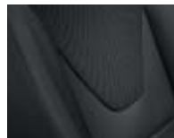
Sellerie tissu Carbone foncé et médaillons gris

Tablette multimédia connectée 7" Renault R-Link : écran tactile + radio + navigation TomTom + bluetooth + USB + jack + connectivité à l'internet + 3D Sound by Arkamys + volant cuir (disponible ultérieurement) Volant cuir Pack Techno : projecteurs antibrouillard, carte mains-libres, lève-vitre conducteur à impulsion Aide au parking arrière Jantes alliage 16" Passion Peinture métallisée Roue de secours (sauf Energy dCi90, 83 g) Gamme Personnalisation