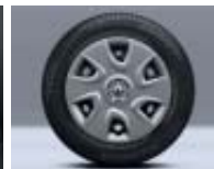
Enjoliveur Extrême 15"