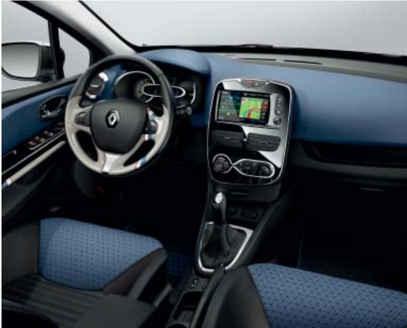
Ambiance intérieure bleue avec décor intérieur Trendy

Trendy, Sport ou Élégant ? Découvrez un avant-goût de la Clio Estate qui vous ressemble et configurez votre véhicule sur notre site www.renault.fr Voici quelques exemples de configurations qui combinent avec harmonie toutes les possibilités offertes par la personnalisation.