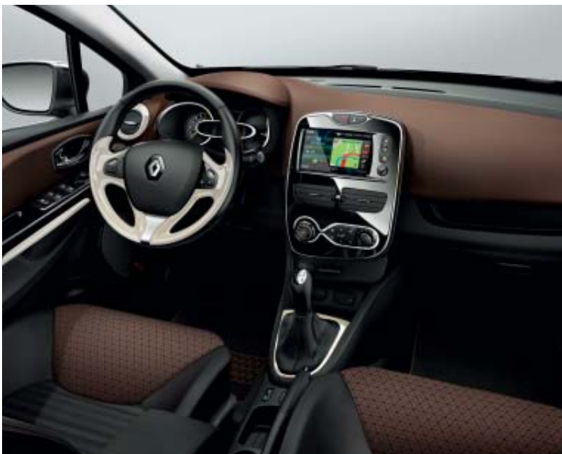
Ambiance intérieure havane avec décor intérieur Élégant *version présentée avec option R-link, disponible ultérieurement