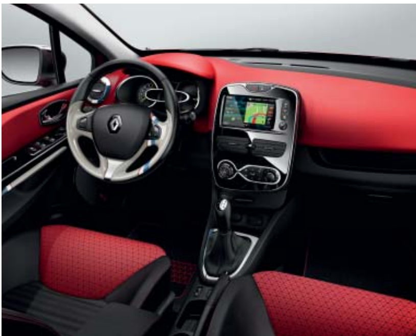
Ambiance intérieure rouge avec décor intérieur Trendy