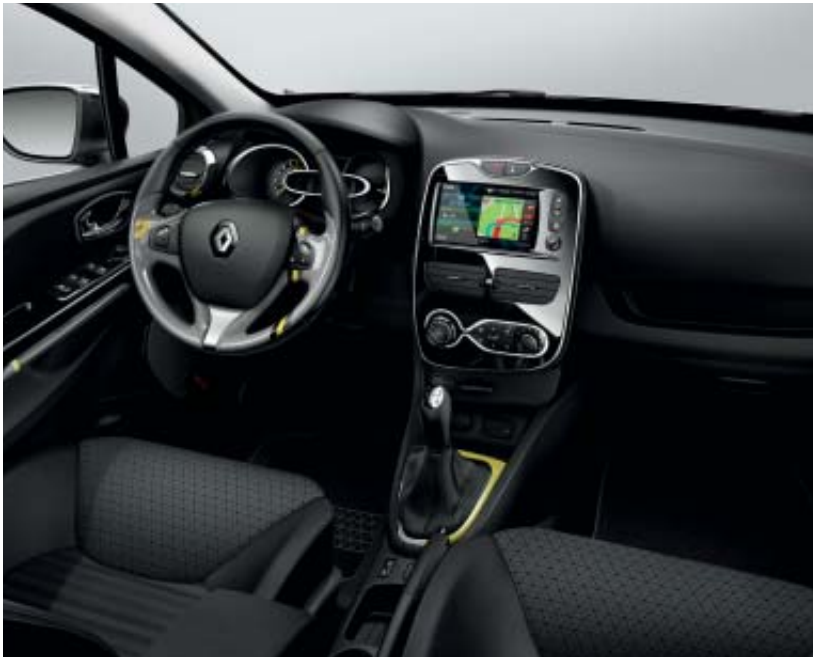
Ambiance intérieure noire avec décor intérieur Sport *version présentée avec option R-link, disponible ultérieurement