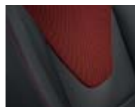
Sellerie tissu Carbone foncé et médaillons rouge