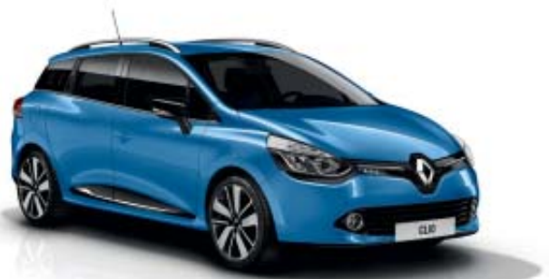
Modèle présenté : teinte de carrosserie Bleu de France, jantes alliage 17" Drenalic noires, joncs chromés.