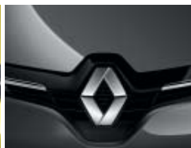
GRIS CASSIOPÉE (MÉTAL)