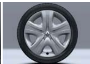
Enjoliveur design Fairway 16"