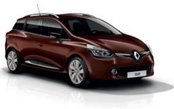
Modèle présenté : teinte de carrosserie Brun Ardent, jantes alliage 17" Drenalic ivoires, joncs ivoires.