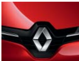
ROUGE FLAMME (MÉTAL)*