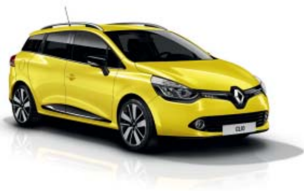
Modèle présenté : teinte de carrosserie Jaune Éclair, jantes alliage 17" Drenalic noires, joncs chromés.