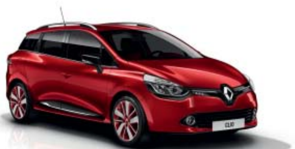
Modèle présenté : teinte de carrosserie Rouge Flamme jantes alliage 17" Drenalic rouges, joncs chromés.