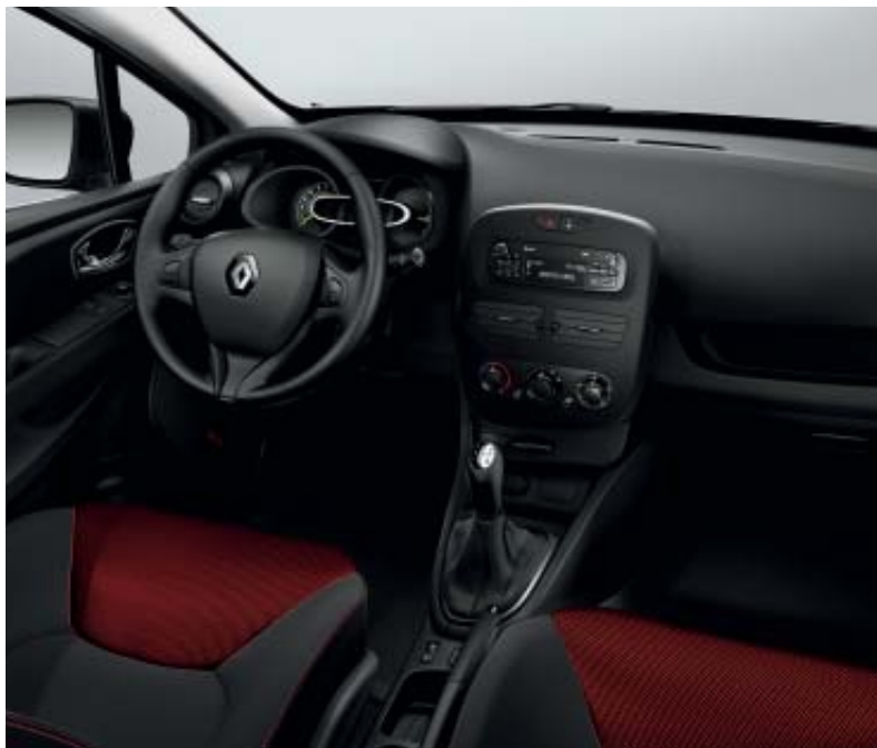
Version présentée avec option R-Plug&Radio