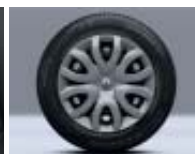
Enjoliveur Paradise 15"