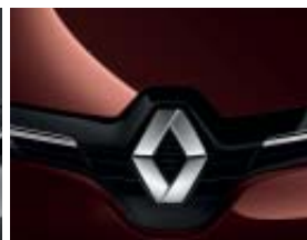
BRUN ARDENT (MÉTAL)