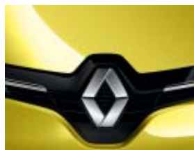
JAUNE ÉCLAIR (OPAQUE)