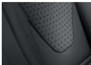
Sellerie tissu et médaillons gris avec sérigraphie