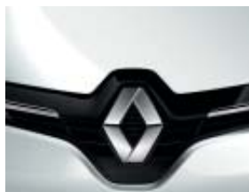
BLANC GLACIER (OPAQUE)

OPAQUE, MÉTALLISÉE... LA PALETTE DE COULEURS S'AFFICHE.