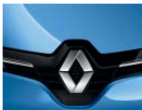
BLEU DE FRANCE (OPAQUE)