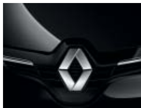
NOIR ÉTOILE (MÉTAL)