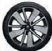
17" « Drenalic » diamantées - Black