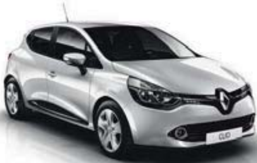
Gris Platine (D69)