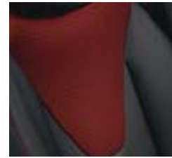
Sellerie tissu «Fortunate» avec médaillons rouges