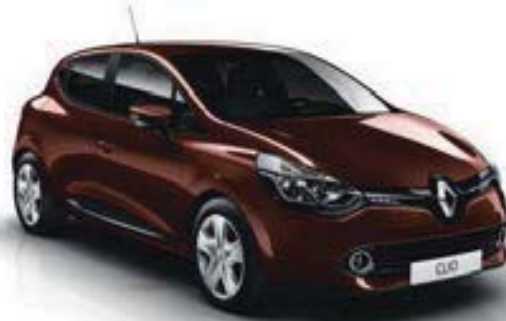
Brun Ardent (CNF) Sauf Limited, Dynamique avec Pack GT-Line et GT 120 EDC