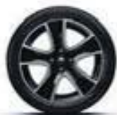
16" « Passion » diamantées - Black