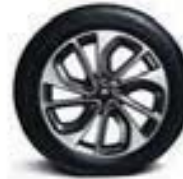
Jantes alu 16" «Akihiro»