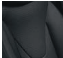
Sellerie tissu «Fortunate» avec médaillons gris