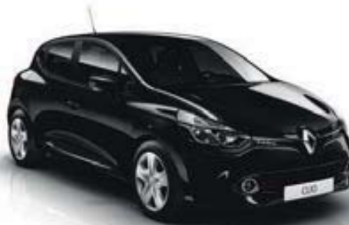
Noir Étoile (GNE)