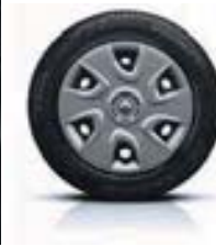
Jantes 15" avec enjoliveurs de roues «Extrême»