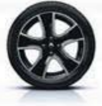
Jantes alu 16" «Passion» diamantées - Black