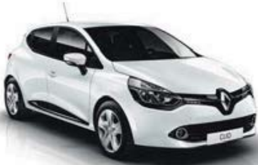
Blanc Glacier (369)*