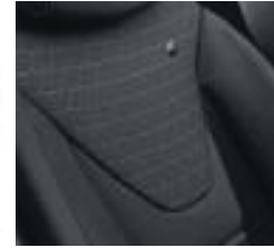
Sellerie tissu «Limited»