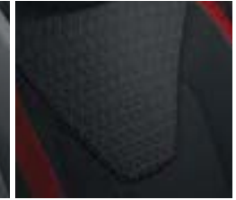
Sellerie tissu «Java» avec ruban rouge