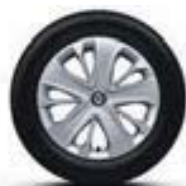
Jantes 15" avec enjoliveurs de roues « Lagoon »