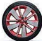
17" « Drenalic » diamantées - Red