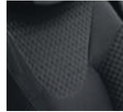
Jantes alu 17" "Silverstone" en gris anthracite brillant Sellerie tissu «Doulisse»