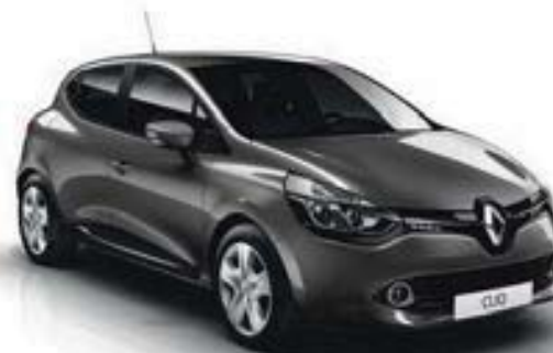
Gris Cassiopée (KNG) Sauf Dynamique avec Pack GT-Line et GT 120 EDC