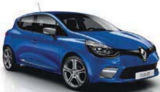
Bleu Malte (RNT) Uniquement Dynamique avec Pack GT-Line et GT 120 EDC