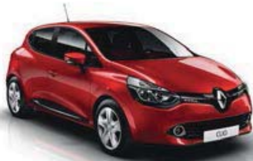
Rouge Flamme (NNP)**