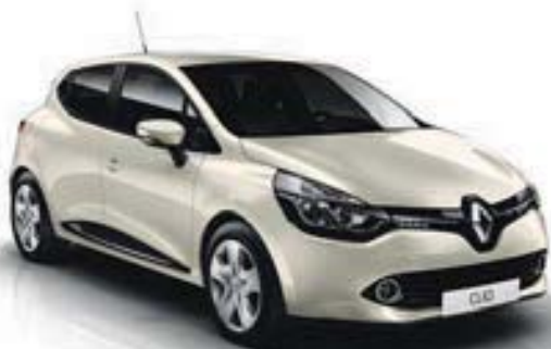
Blanc Ivoire (D16)* Sauf Limited, Dynamique avec Pack GT-Line et GT 120 EDC