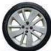
17" « Drenalic » diamantées - Ivory