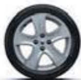
16" « Passion »