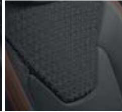
Sellerie tissu «Java» avec ruban havane