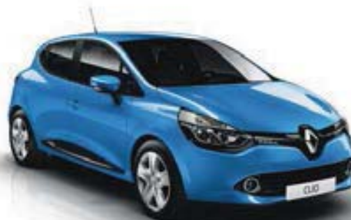
Bleu De France (RPJ)* Sauf Authentique, Limited, Dynamique avec Pack GT-Line et GT 120 EDC