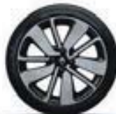
17" « Drenalic » diamantées - Black