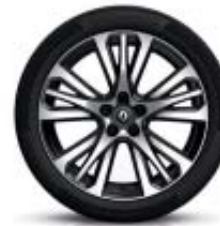
19" Initiale Paris