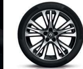
19" Initiale Paris