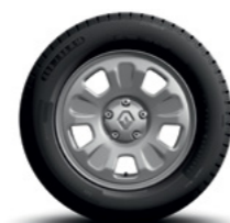
RODA DE AÇO ARO 16"