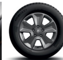
RODA DE LIGA LEVE ARO 16" CINZA ESCURO