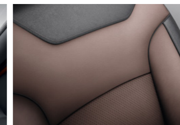
Couro Dynamique 4x2 e 4x4