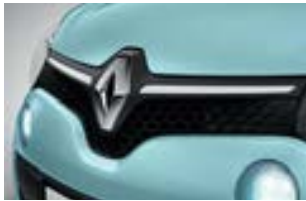
Décor extérieur White