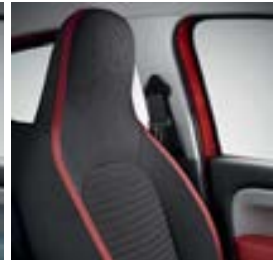
Sellerie tissu «Praya» avec ruban rouge