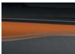
Motif "New Burning" Orange avec Gris Lunaire KPE