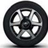
Jantes alu 15" «Argos»