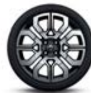
Alu 17" « Twin'Run »