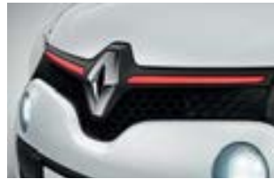
Décor extérieur Red