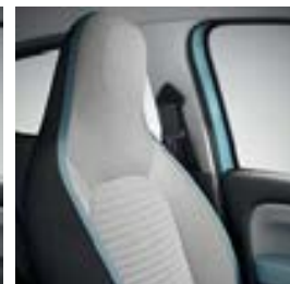
Sellerie tissu « Praya » avec ruban bleu