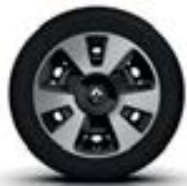
15" « Akaju » - Black