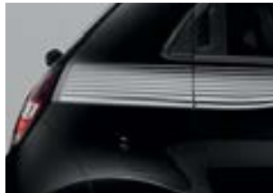
Motif «Stripes» en blanc ou noir*