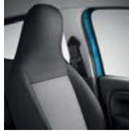
Sellerie tissu « Kario »