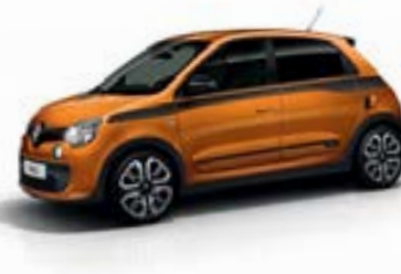
Orange Piment (EPP)** uniquement GT