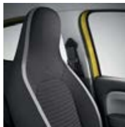
Sellerie tissu « Praya » avec ruban blanc