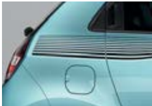
Motif «Lines» en blanc ou noir*