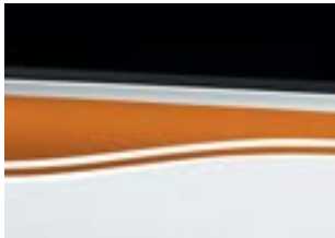
Motif "New Burning" Orange avec Blanc Cristal QNJ