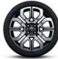
Jantes alu 17" «Twin'Run»