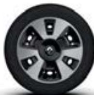
Jantes 15" avec enjoliveurs de roues « Akaju » - Black