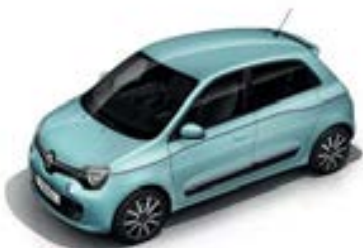
Bleu Dragée (RPP)* sauf GT