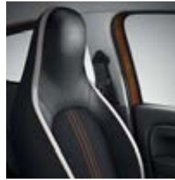
Sellerie tissu / cuir d'imitation «GT»