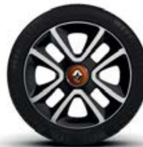
Alu 16" "Juvaquatre"