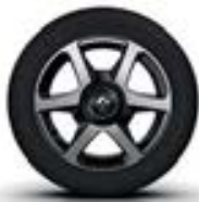
Alu 15" « Argos »