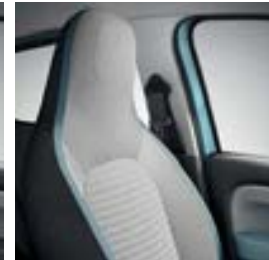
Sellerie tissu «Praya» avec ruban bleu