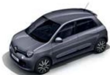
Gris Lunaire (KPE)