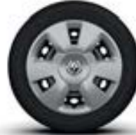
Jantes 15" avec enjoliveurs de roues « Akaju »