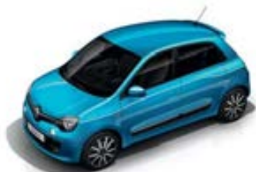
Bleu Pacific (RPM) sauf GT