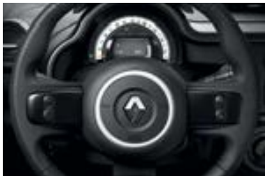
Décor intérieur Black