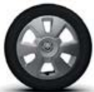
15" « Akaju »