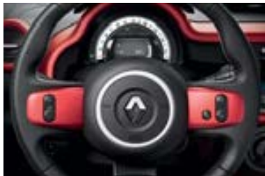
Décor intérieur Red