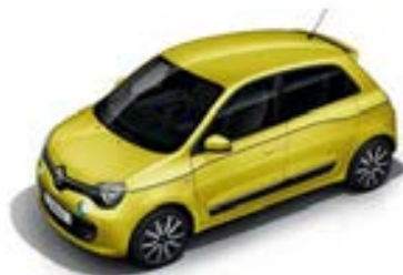
Jaune Éclair (ENW)* sauf GT