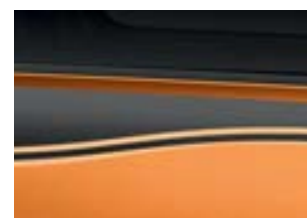
Motif "New Burning" Black avec Orange Piment EPP

* Motifs «Lines» et «Stripes» en blanc avec les teintes de carrosserie claires et en noir avec les teintes de carrosserie foncées.