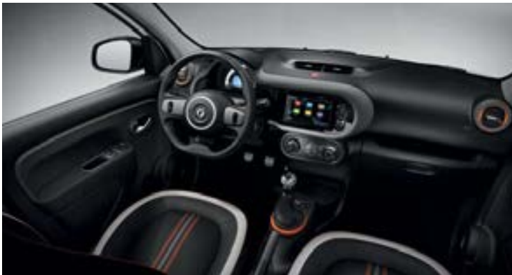
Ambiance intérieure Orange/Black