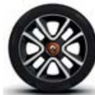
Alu 16" « Juvaquatre »