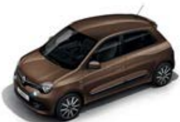
Brun Cappuccino (CNL) sauf GT