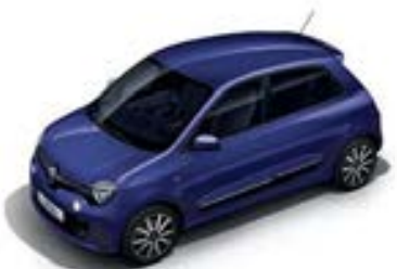
Ultra Violet (LNF) sauf GT