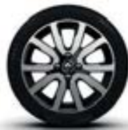
Alu 16" « Embleme »