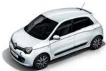
Blanc Cristal (QNJ)*