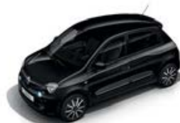
Noir Étoile (GNE)