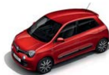
Rouge Flamme (NNP)** sauf GT