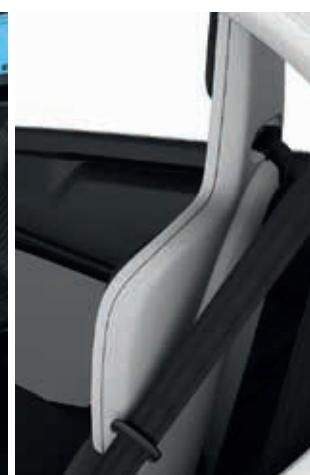
Sitzschale Weiß (optional)