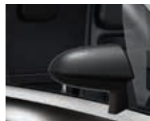
GNE Black-Pearl-Schwarz 2