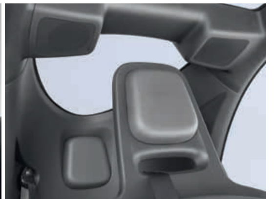
Abb. zeigen Zubehör und Optionen.