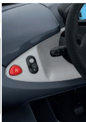
Armaturenbrett Weiß (optional)