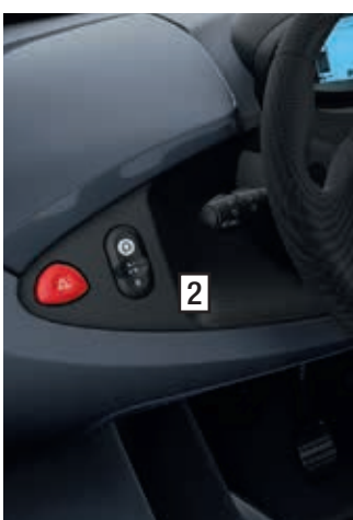
Armaturenbrett Schwarz (serienmäßig)