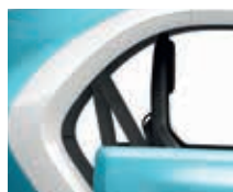
QNF Iglu-Weiss 1