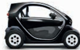
GNE Black-Pearl-Schwarz 2