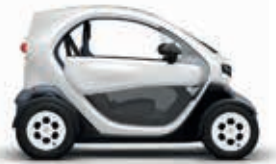
QNF Iglu-Weiss 2