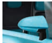
RPS Karibik-Blau 2