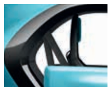
GNE Black-Pearl-Schwarz 1