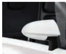
QNF Iglu-Weiss 2