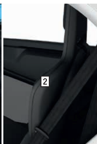
Sitzschale Schwarz (serienmäßig)