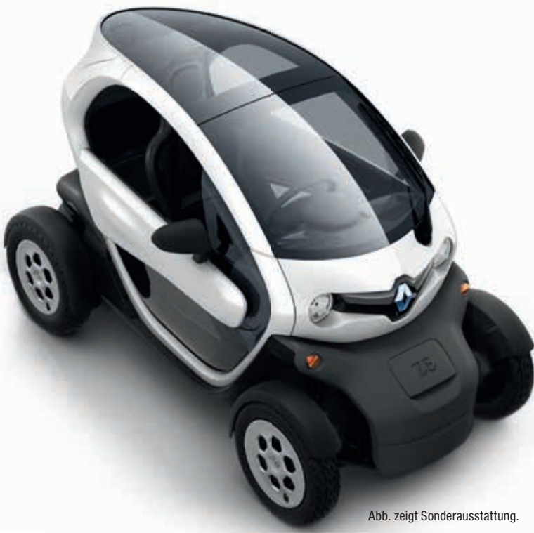
Abb. zeigt Sonderausstattung.

Dank des pfiffigen Sitzkonzepts des Twizy können es sich Fahrer und Beifahrer gleichermaßen bequem machen. Bleibt die Frage, ob Sie die große Offenheit mögen oder lieber etwas unter sich bleiben möchten. Denn als Option können Sie Ihren Twizy auch mit halbhohen, nach oben öffnenden Flügeltüren* oder einem Wetterschutz** für Fahrer und Beifahrer ausrüsten. Ebenso optional ist das transparente Dach für eine großartige Panoramasicht und viel Licht im Innenraum. Und damit Sie keinen Anruf verpassen und stets Zugriff auf Ihr Telefonbuch sowie Ihre Lieblingsmusik haben, sollten Sie sich für die praktische Bluetooth Audio- und Freisprecheinrichtung mit LCD-Display und Lautsprechern entscheiden. So sind Sie für das mobile Leben in der Stadt perfekt gerüstet. Und für stets trockenen Einstieg sorgt die Fahrzeughülse aus wetterfestem Polyamid.** *Optional erhältlich. Nicht nachrüstbar. **Zubehör.