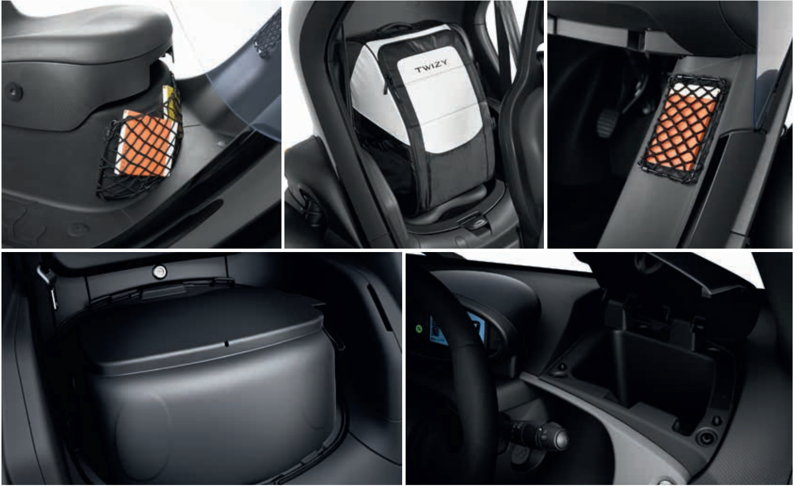
Abb. zeigen Zubehör.