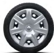
Calota Fuego 15"