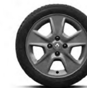
*Roda Nepta Dark Metal 15"