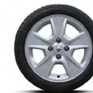
Roda Nepta 15"