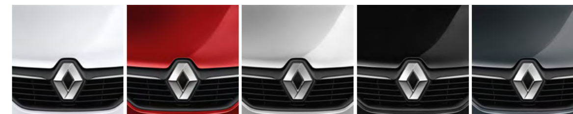
BRANCO NEIGE (OE)