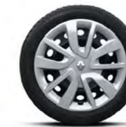
Calota Magiceo 15"