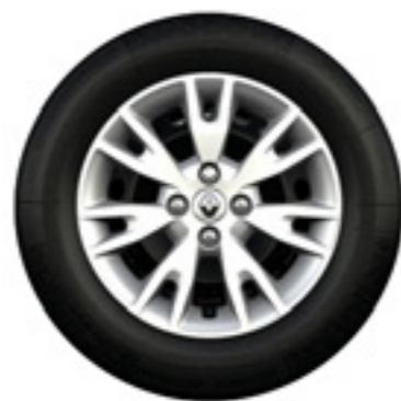
Calotas Eptius 15"