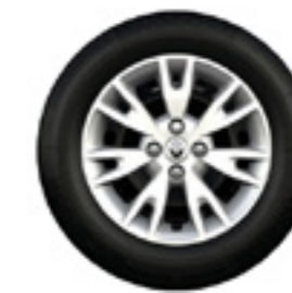
Calotas Eptius 15"