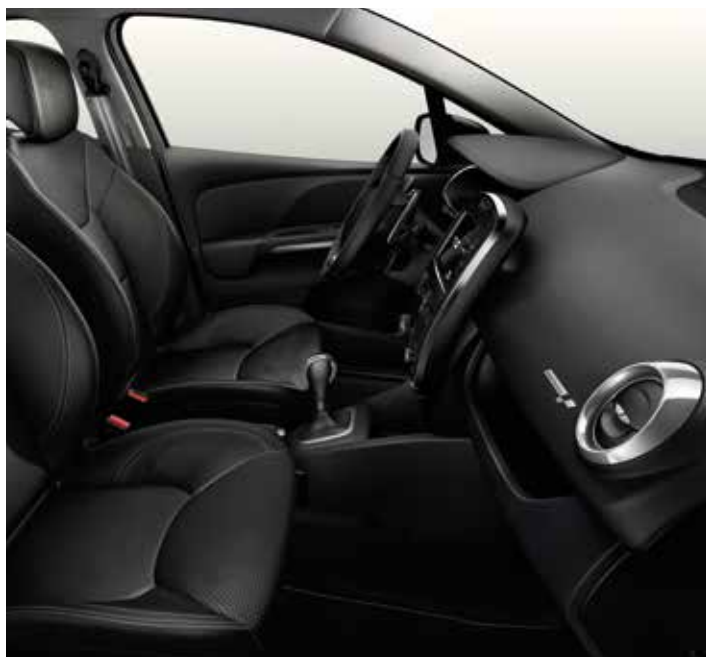
Ledersitzbezug Riviera Carbone dunkel mit Schriftzug MONACO GP und grauen Ziernähten

Elektrische Fensterheber vorne (mit Schnellsenkfunktion auf Fahrerseite) Multimediasystem MEDIA NAV mit 7"-Touchscreen: Radio 4 x 20 W + Navigation + Audiostreaming Bluetooth® + Freisprecheinrichtung + USB- und Jack-Anschluss Launch Control System Elektronisches Differential R.S. Knopf R.S. DRIVE zur Schalloptimierung Elektrisch einklappbare und beheizbare Aussenspiegel (asphärisch auf Fahrerseite) Licht- und Regensensor Lenkrad höhenverstellbar Tempomat mit Geschwindigkeitsbegrenzer Renault Karte Keyless-Drive Hands-free (Entriegeln, Starten des Motors und automatisches Verriegeln beim Sichertfernen) Manuelle Klimaanlage mit Pollenfilter Fahrersitz höhenverstellbar