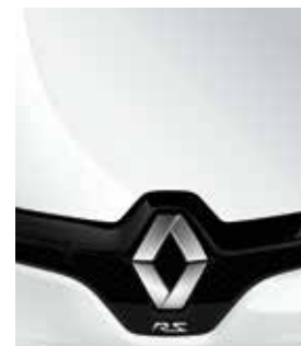
BLANC GLACIER (MATT)

MATT, METALLIC... DIE FARBPALETTE KANN SICH SEHEN LASSEN.