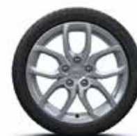
17" GRIS SILVER

WÄHLEN SIE DEN STIL, DER ZU IHNEN PASST.