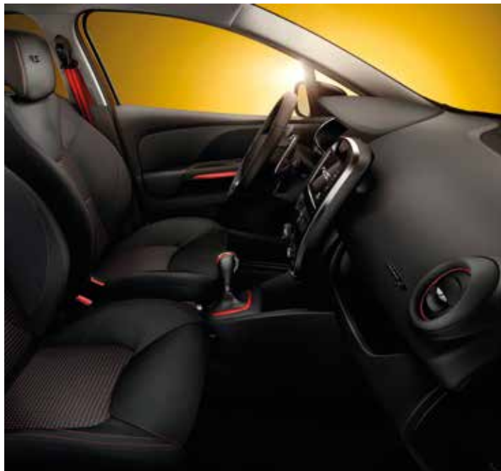
Stoffsitzbezug R.S. in Schwarz