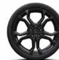
18" NOIR BRILLANT