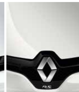
GIVRE NACRÉ (METALLIC)*