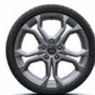
18" DARK MÉTAL