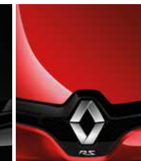
ROUGE FLAMME (METALLIC)