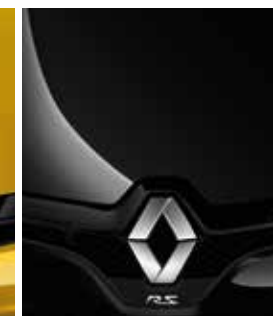
NOIR PROFOND (METALLIC)