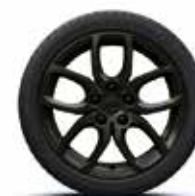
17" NOIR BRILLANT