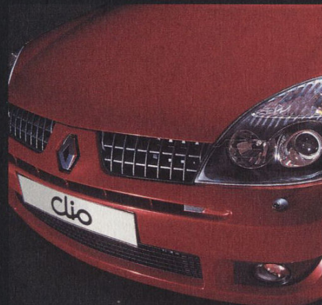
Strakkere lijnen, nieuwe grille en dubbele koplampen.

Zowel het interieur als het exterieur zijn gerestyled vanuit een duidelijke toekomstvisie. Het interieur is zelfs geheel vernieuwd: de toegepaste hoogwaardige materialen geven het design in één oogopslag een onmiskenbaar kwalitatieve uitstraling. En dan de 'buitenkant'. De lijnen zijn strakker, de nieuwe grille en dubbele koplampen versterken z'n dynamiek en maken de Renault Clio tot een onweerstaanbare persoonlijkheid. Kortom, u raakt al snel geïnspireerd door z'n uiterlijk, dus bent u misschien nieuwsgierig naar de ongekende rijprestaties van de nieuwe Renault Clio.