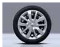
Calota Magiceo 15"

Alarme perimétrico (portas, porta-malas e capô) Alças de segurança fixadas no teto (1 na parte dianteira / 2 na parte traseira) Apoios de cabeça dianteiros com altura regulável Ar-condicionado Banco do motorista com altura regulável Coluna central com acabamento na cor preta Comando de abertura das portas por radiofrequência Computador de bordo multifuncional Iluminação do porta-luvas Maçanetas externas na cor da carroceria Medidores do painel de instrumentos na cor preta