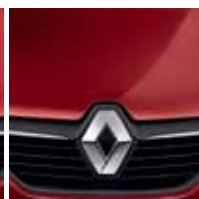
Vermelho Fogo (PM)