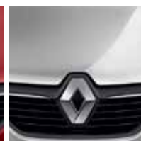
Prata Étoile (PM)