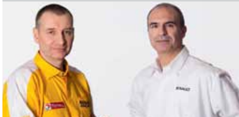
ROB WHITE Diretor da Renault Sport F1®