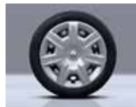
Calota Fuego 15"

Abertura interna da tampa do porta-malas e reservatório de combustível Acelerador eletrônico Air bags do motorista e passageiro Alarme sonoro de advertência de luzes acesas Apoios de cabeça dianteiros fixos Ar quente Banco traseiro rebatível 1/1 Barra de proteção lateral Brake light Calotas integrais com diâmetro de 15" modelo Fuego Cintos de segurança de 3 pontos dianteiros e traseiros laterais retráteis Cintos de segurança dianteiros com altura regulável Cinto de segurança abdominal no assento traseiro central Conta-giros