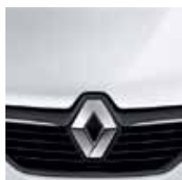
Branco Neige (OE)

CO: Cor opaca OE: Opaca especial PM: Pintura metálica