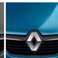
Azul Techno (PM)