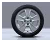
Roda Nepta 15"

Techno Pack Plus EASY'R (Câmbio EASY'R, sistema multimídia Media NAV 1.2, sensor de estacionamento, ar-condicionado automático e sensor de temperatura)