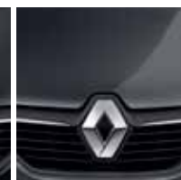
Cinza Acier (PM)