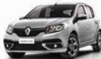
Prata Étoile (PM)