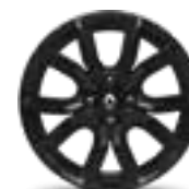
RODA 16" PIT LANE