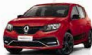
Vermelho Vivo (CO)

CO: cor opaca OE: opaca especial PM: pintura metálica