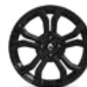
RODA 17" GRAND PRIX (item opcional)