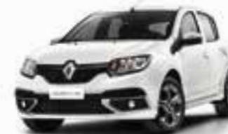
Branco Neige (OE)