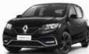
Preto Nacré (PM)