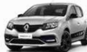
Prata Étoile (PM)