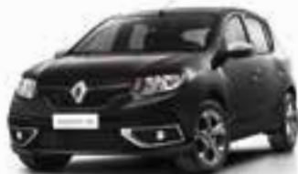
Preto Nacré (PM)