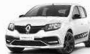
Branco Neige (OE)