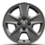
RODA 15" NEPTA DARK METALLIC