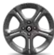
RODA 16" INTERLAGOS (item opcional)