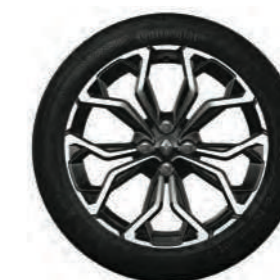
Roda de liga leve 17" Pit Lane