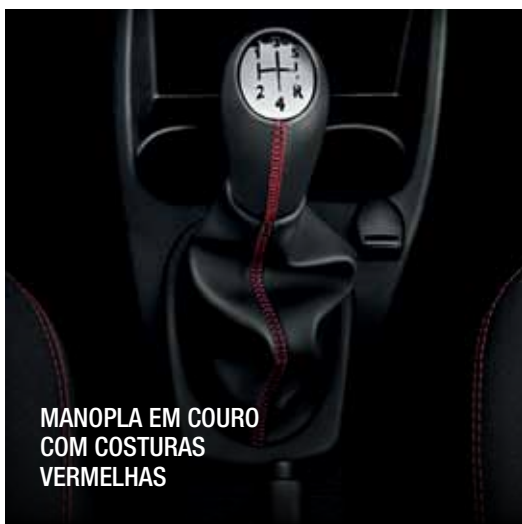
MANOPLA EM COURO COM COSTURAS VERMELHAS