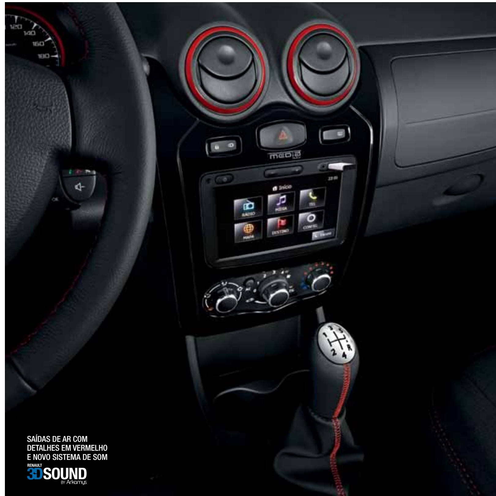
SAÍDAS DE AR COM DETALHES EM VERMELHO E NOVO SISTEMA DE SOM