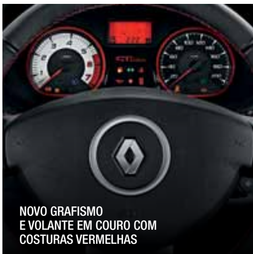
NOVO GRAFISMO E VOLANTE EM COURO COM COSTURAS VERMELHAS

SANDERO GT LINE. ESPORTIVIDADE EM TODOS OS DETALHES.