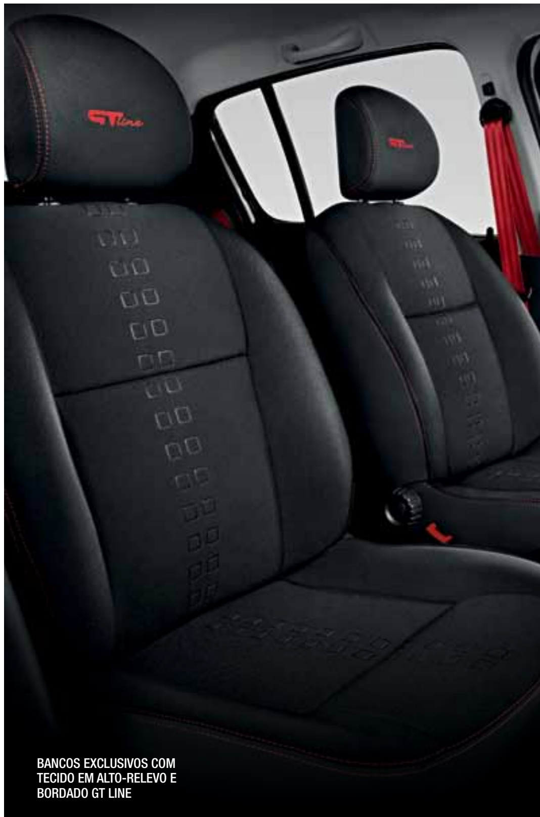
BANCOS EXCLUSIVOS COM TECIDO EM ALTO-RELEVO E BORDADO GT LINE