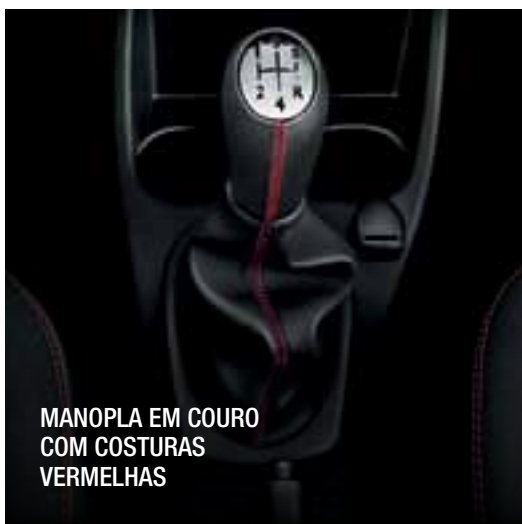
MANOPLA EM COURO COM COSTURAS VERMELHAS