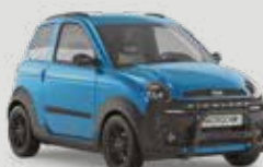
M.Go Highland X