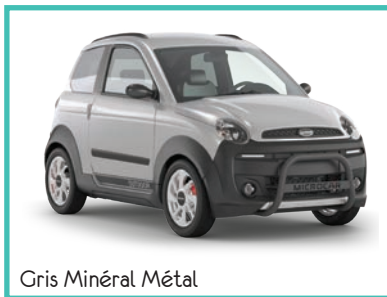
Gris Minéral Métal