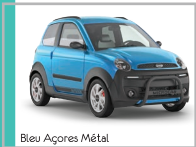
Bleu Açores Métal