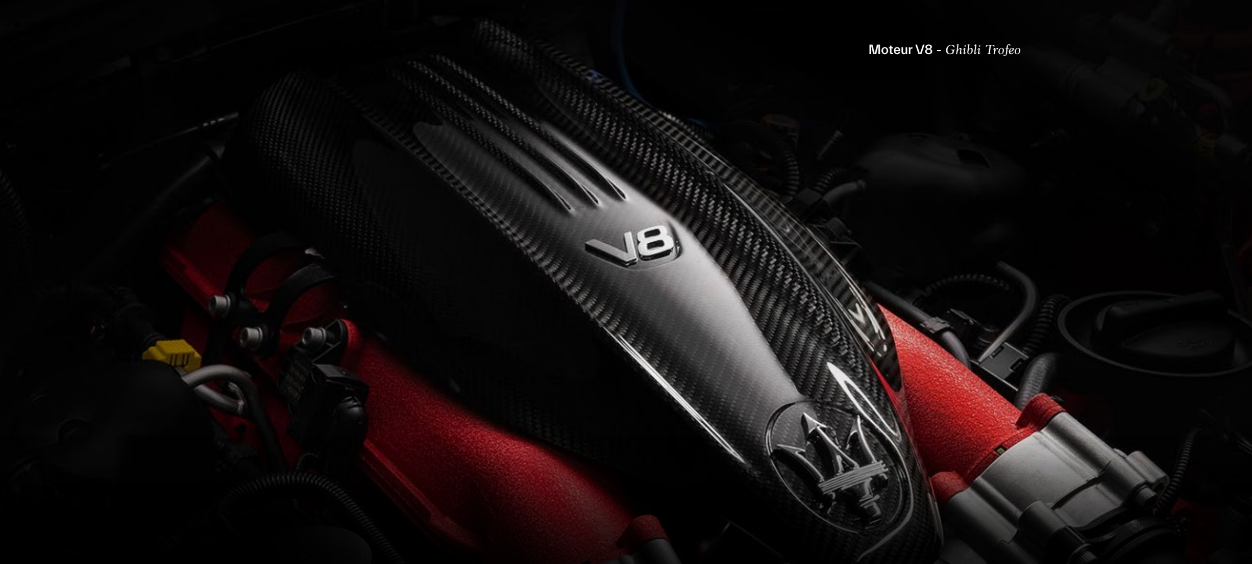
Moteur V8 - Ghibli Trofeo

L'une des caractéristiques essentielles de tous les véhicules Maserati est leur capacité à parcourir de longues distances à grande vitesse, avec dynamisme et raffinement.