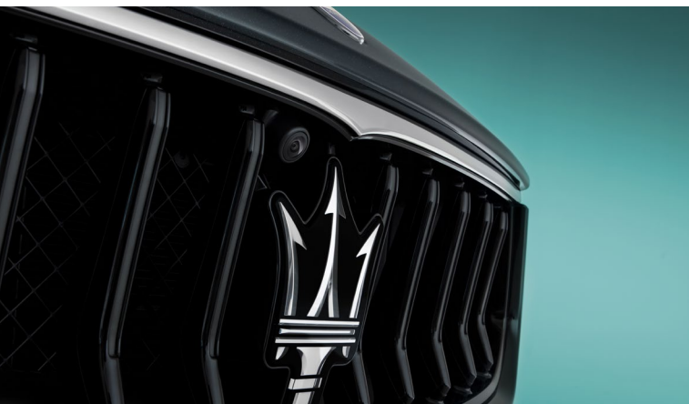
Ghibli - Calandre