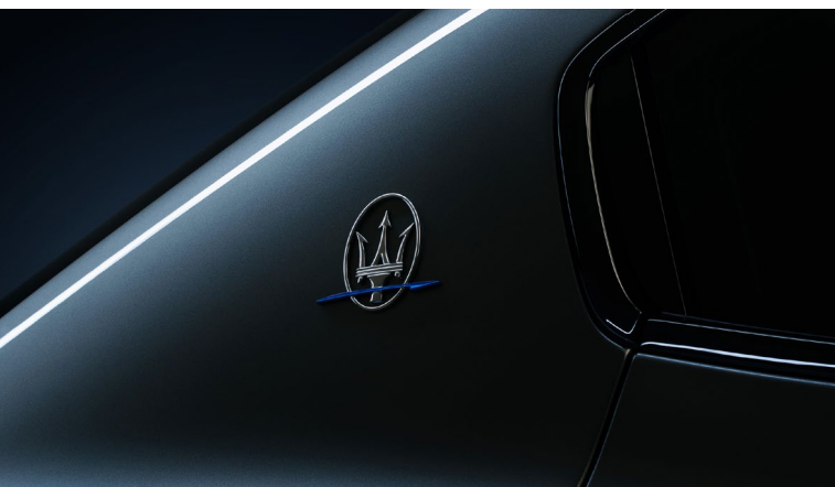
Ghibli Hybrid - Logo Saetta emblématique sur le pilier C