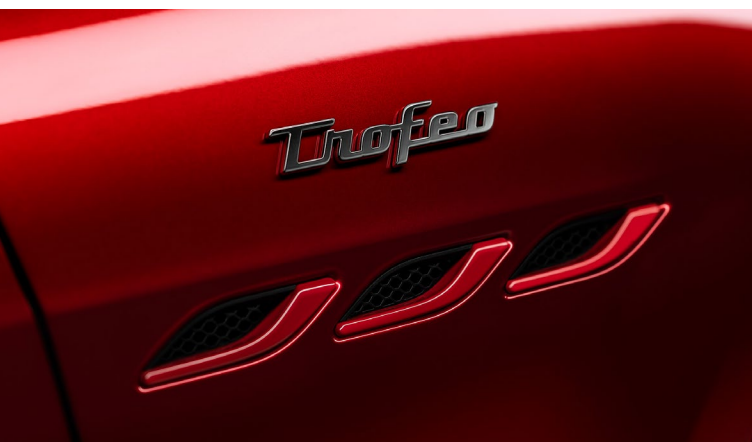
Ghibli Trofeo - Ouies latérales et badge Trofeo