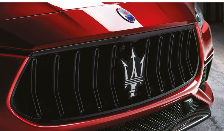
Ghibli Trofeo - Calandre

Vivez audacieusement. Conduisez avec caractère. Démarquez-vous en seulement 4,3 secondes avec l'ultime Maserati Ghibli Trofeo. Avec 580 ch et une vitesse de pointe de 326 km/h, la Ghibli Trofeo est la plus puissante jamais créée . Le champ des possibles prend une autre dimension. La ligne remarquable de la Ghibli, intensifiée par des éléments de design inspirés de la course. La fibre de carbone brillante à l'avant, à l'arrière et sur les ouies latérales, ainsi que le capot Trofeo sculpté avec des extracteurs d'air vous donnent un avant-goût de ce qui vous attend lorsque vous prendrez le volant. C'est ainsi que la Ghibli Trofeo a vu le jour. Née de la compétition, améliorée par le confort et dotée d'un sens inné de la beauté intemporelle.