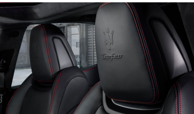
Ghibli Trofeo - Détail de l'appui-tête