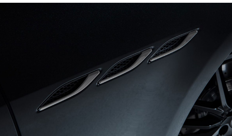
Ghibli - Ouïes latérales