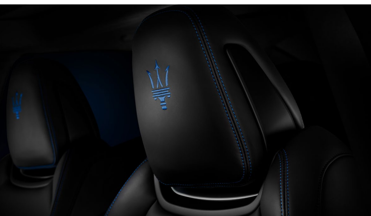
Ghibli Hybrid - Détail de l'appui-tête