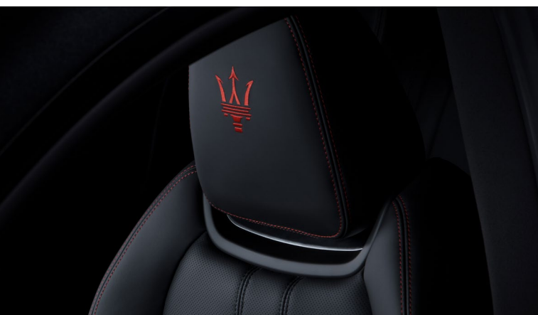
Ghibli - Détail de l'appui-tête