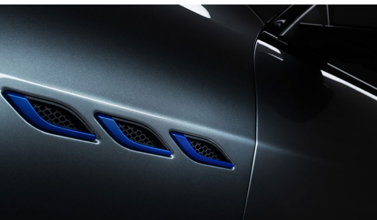
Ghibli Hybrid - Ouïes latérales

Dans la nature, il y a des moments où une simple étincelle donne naissance à quelque chose de nouveau, un instant où l'hybridation agit comme un catalyseur de changement. C'est ce qui a inspiré la nouvelle Maserati Ghibli Hybrid : la première d'une lignée de nouveaux véhicules, à l'avant-garde d'une ère naissante pour la marque. La Ghibli Hybrid enflamme l'avenir de Maserati sans trahir le passé. Le premier moteur hybride dans l'histoire de la marque, où l'innovation et la technologie ont toujours été associées à une ingénierie automobile de haute performance, pour faire avancer Maserati vers un avenir plus durable. Plus rapide que le diesel, plus écologique que l'essence : la philosophie de la Ghibli Hybrid en quelques mots.