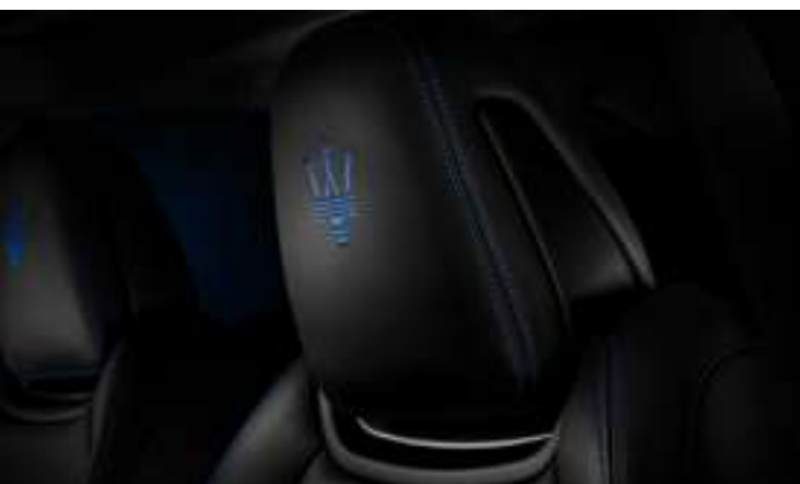
Ghibli GT Hybrid - Détail de l'appui-tête