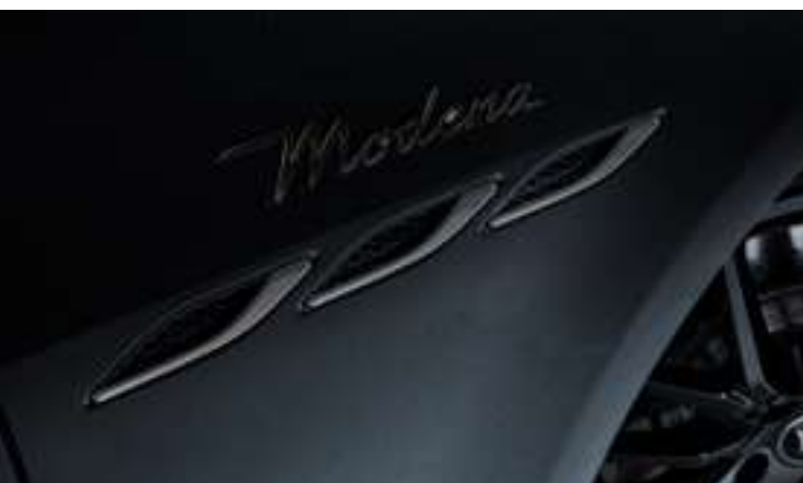
Ghibli - Ouïes latérales et badge Modena