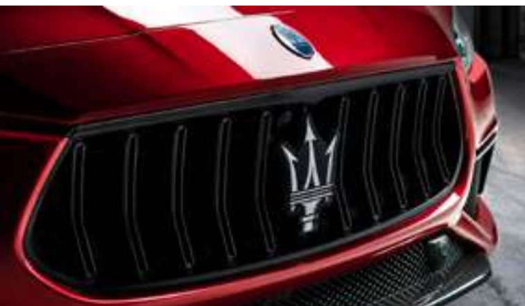
Ghibli Trofeo - Calandre

Vivez audacieusement. Conduisez avec caractère. Démarquez-vous en seulement 4,3 secondes avec l'ultime Maserati Ghibli Trofeo. Avec 580 ch et une vitesse de pointe de 326 km/h, la Ghibli Trofeo est la plus puissante jamais créée . Le champ des possibles prend une autre dimension. La ligne remarquable de la Ghibli, intensifiée par des éléments de design inspirés de la course. La fibre de carbone brillante à l'avant, à l'arrière et sur les ouies latérales, ainsi que le capot Trofeo sculpté avec des extracteurs d'air vous donnent un avant-goût de ce qui vous attend lorsque vous prendrez le volant. C'est ainsi que la Ghibli Trofeo a vu le jour. Née de la compétition, améliorée par le confort et dotée d'un sens inné de la beauté intemporelle.