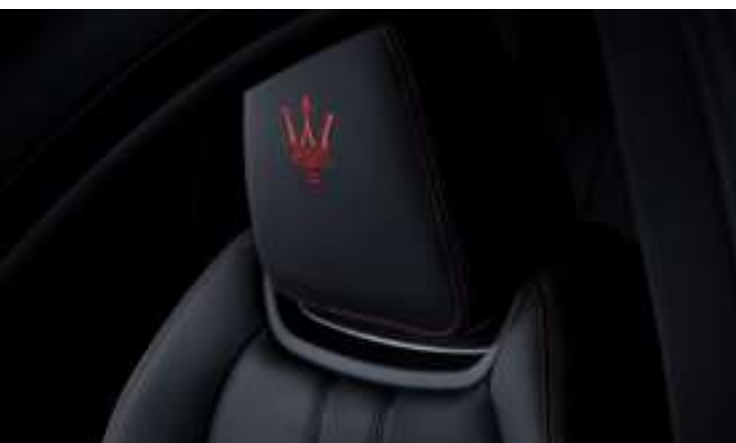
Ghibli - Détail de l'appui-tête