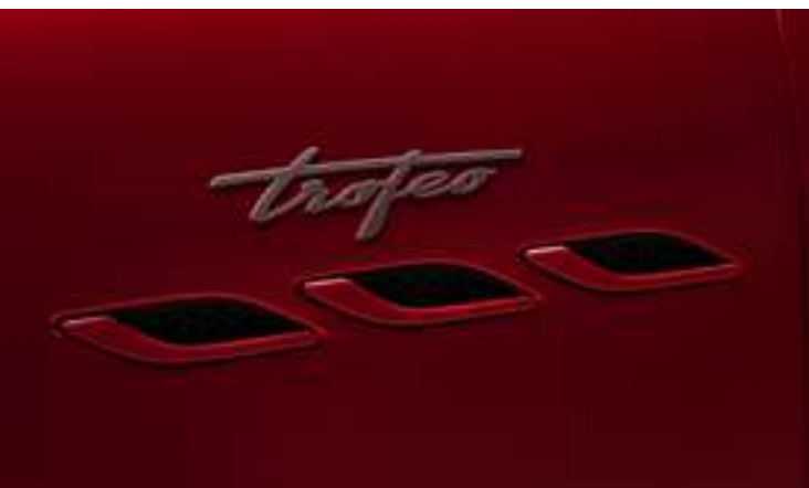
Ghibli Trofeo - Ouies latérales et badge Trofeo