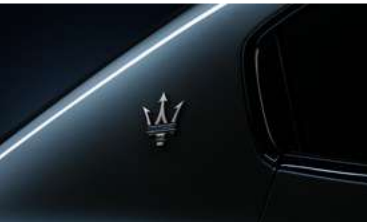
Ghibli GT Hybrid - Logo du Trident sur le pilier C