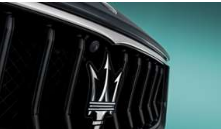
Ghibli - Calandre