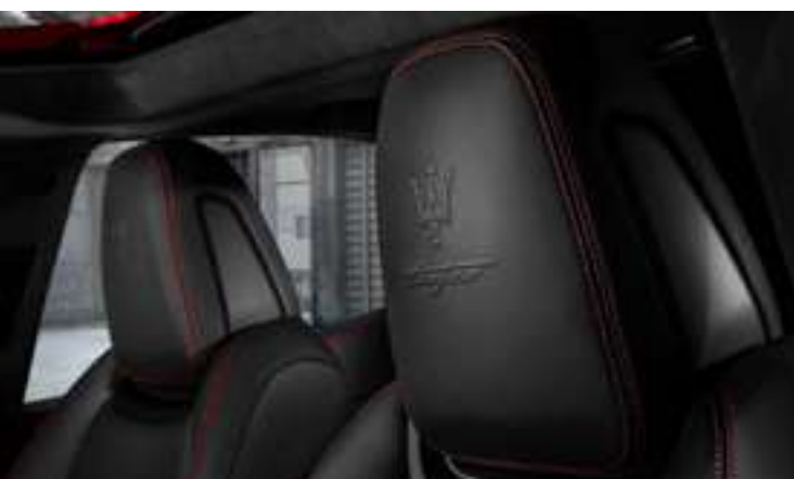
Ghibli Trofeo - Détail de l'appui-tête