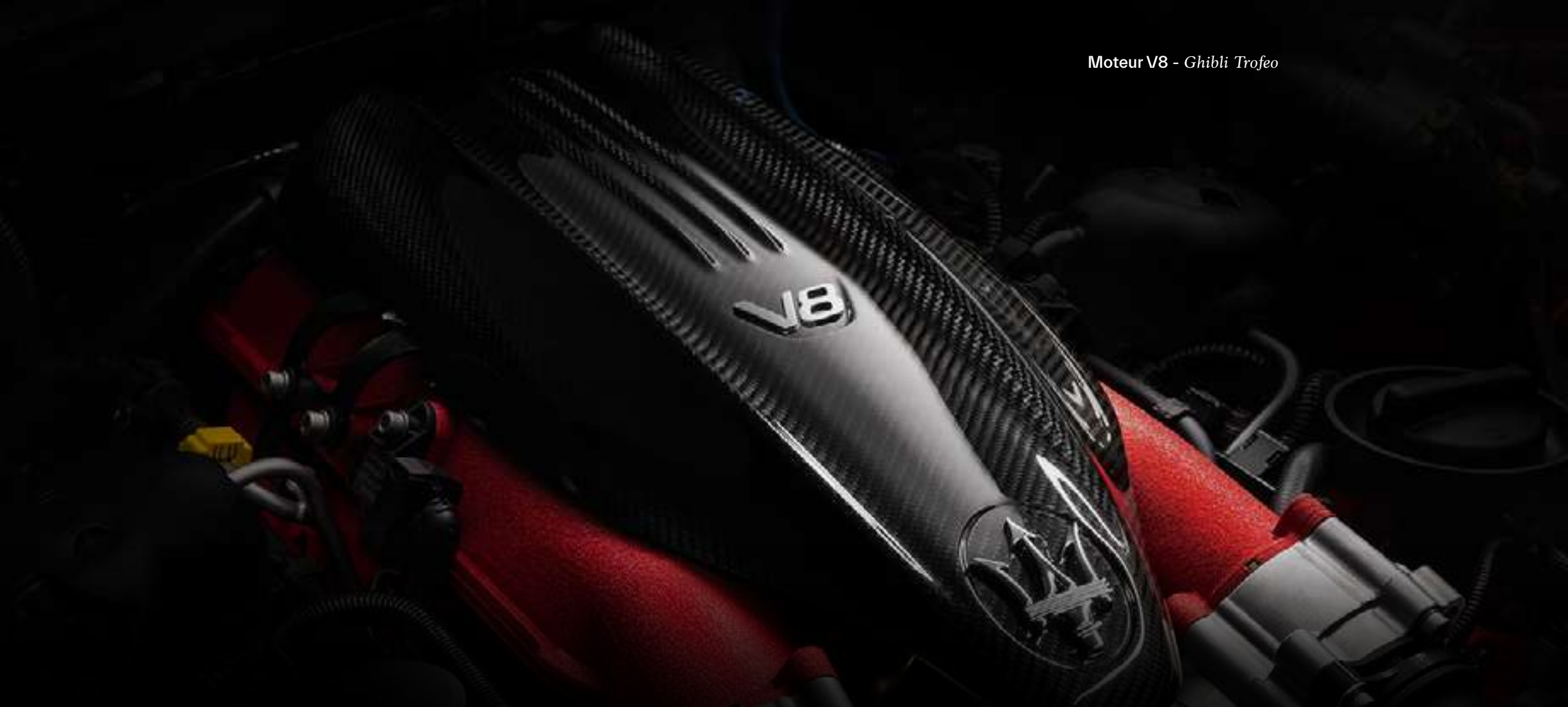
Moteur V8 - Ghibli Trofeo

L'une des caractéristiques essentielles de tous les véhicules Maserati est leur capacité à parcourir de longues distances à grande vitesse, avec dynamisme et raffinement.