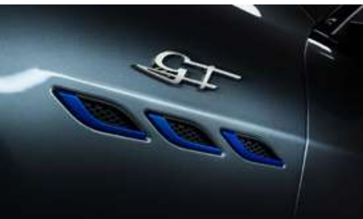
Ghibli GT Hybrid - Ouïes latérales et badge GT